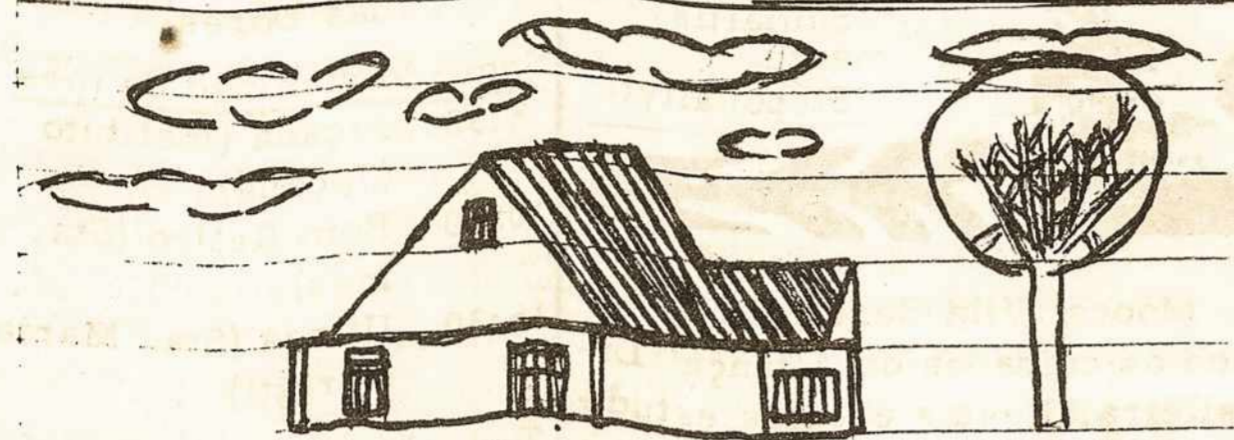
Piešė N. Malinauskas, 8 metų, V. Želina.