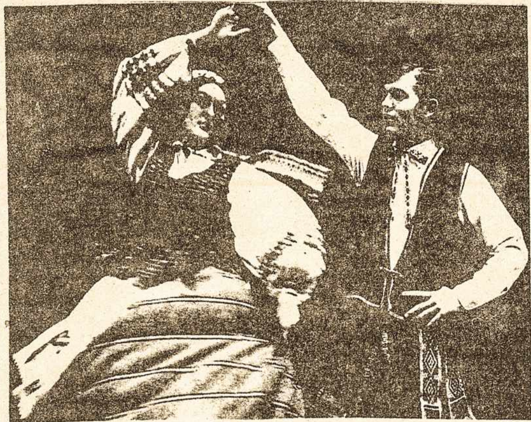
Grandies šokėjų pora. Jų statomos Lietuviškos vestuvės bus balandžio 1 d. Chicagoje.