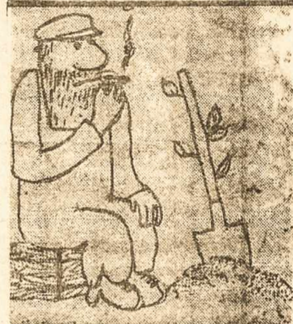
Nuostabusis raudonojo rojaus darbininkas Piešinys Bereznieko

— Kada žmona pasidažo truputį lūpas, nenešk jai šlapio skuduro nusišluoštyti, nes tau patinka nusidažiusios svetimios moterys.