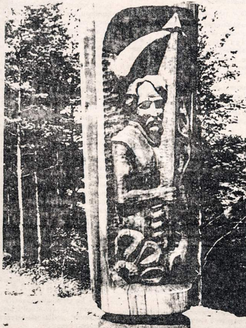
Čiurlioniškas stogastulpis prie Varėnos — Druskininkų kelio, vaizduojas idilišką Lietuvos gamtovaizdį. Tai liaudies meistrų menas

Montrealyje lietuvių tarpe pradžioje atsirado tik keli žmonės, kurie įsijungė į šį sambūrį ir sugrįžo į blaivų, produktingą, normalų gyvenimą. Jų grupė augo, o dabar jau skaitoma dešimtimis. Jų nariai vienas kitam padeda kovoti su šia kankinančia liga. Atrodo, kad daug kam iš torontiečių būtų labai naudinga įsijungti į tokį sambūrį.