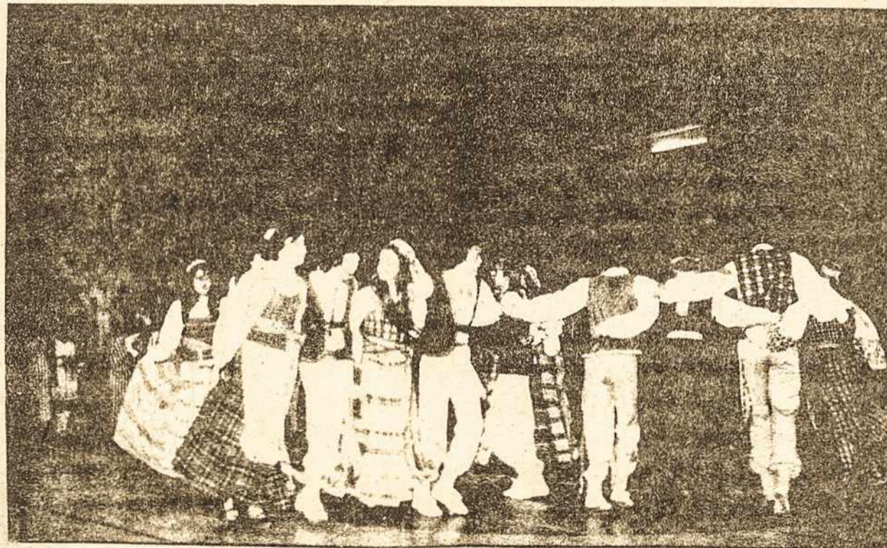
RŪTELĖ IMIGRANTŲ FESTIVALY ŠOKA MALŪNA

Pasaulio Lietuvių Bendruomenės valdyba JAV Lietuvių Bendruomenės krašto valdyba Kanados Lietuvių Bendruomenės krašto v-ba Pasaulio Lietuvių B-nės seimo organizacinis k-tas V-sios Kanados ir JAV Lietuvių Dainų Šventės organizacinis komitetas Pasaulio Lietuvių Sportinių Žaidynių organizacinis k-tas Pasaulio Lietuvių Jaunimo Sąjungos valdyba