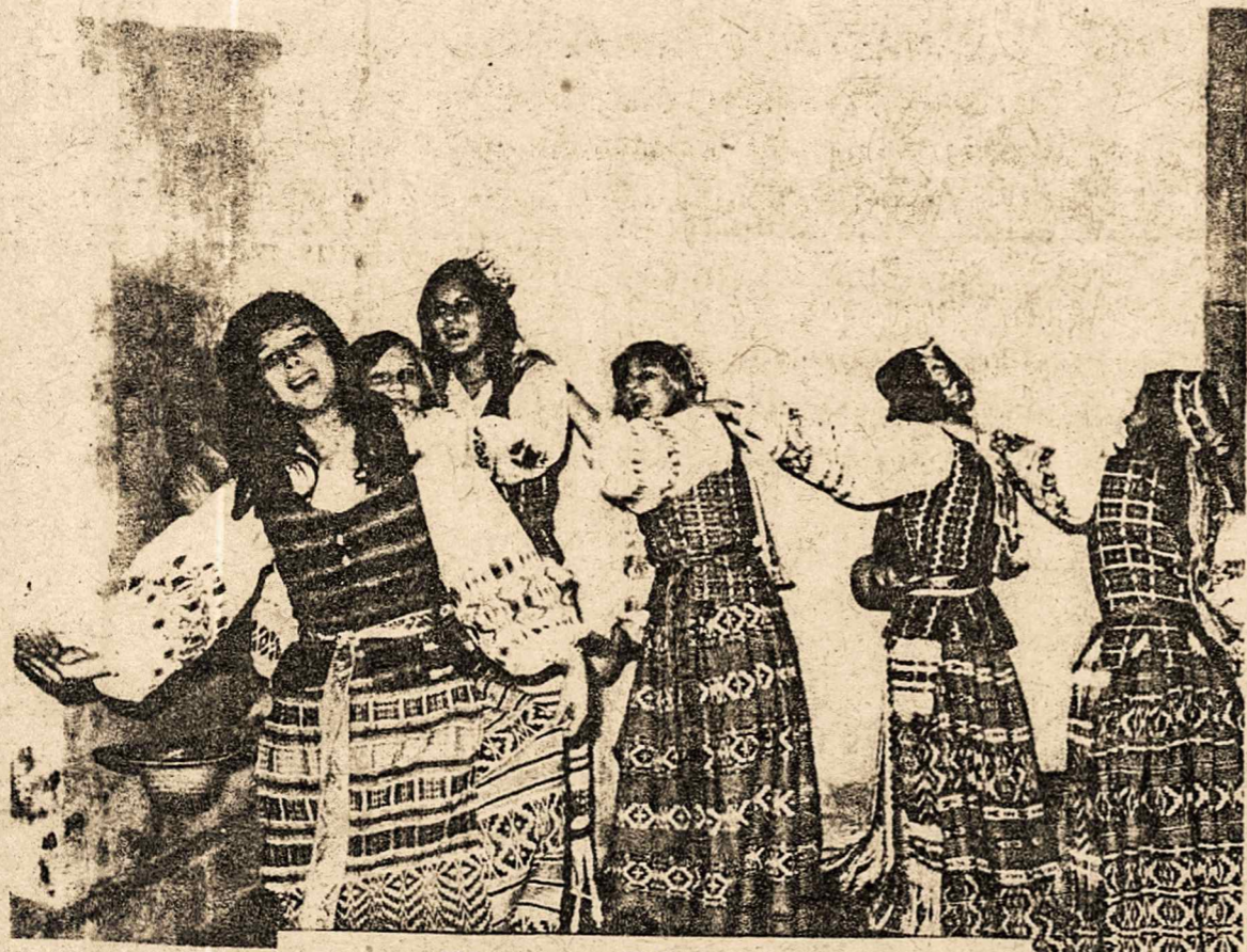
"Nemunus" šoka Kepurinė