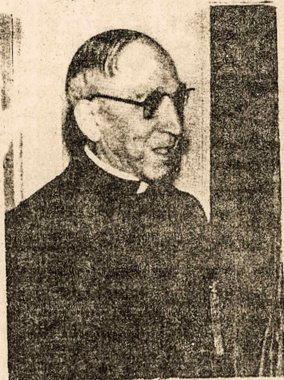
Arkivyskupas A. CASAROLI, Vatikano atstovas, dažnai lankas komunistinių kraštų sostines

Vengrija. Yra 6,8 milijono katalikų. Pagaliau buvo paskirti vyskupai visoms 10 vyskupijų ir palengvintas religinis auk-