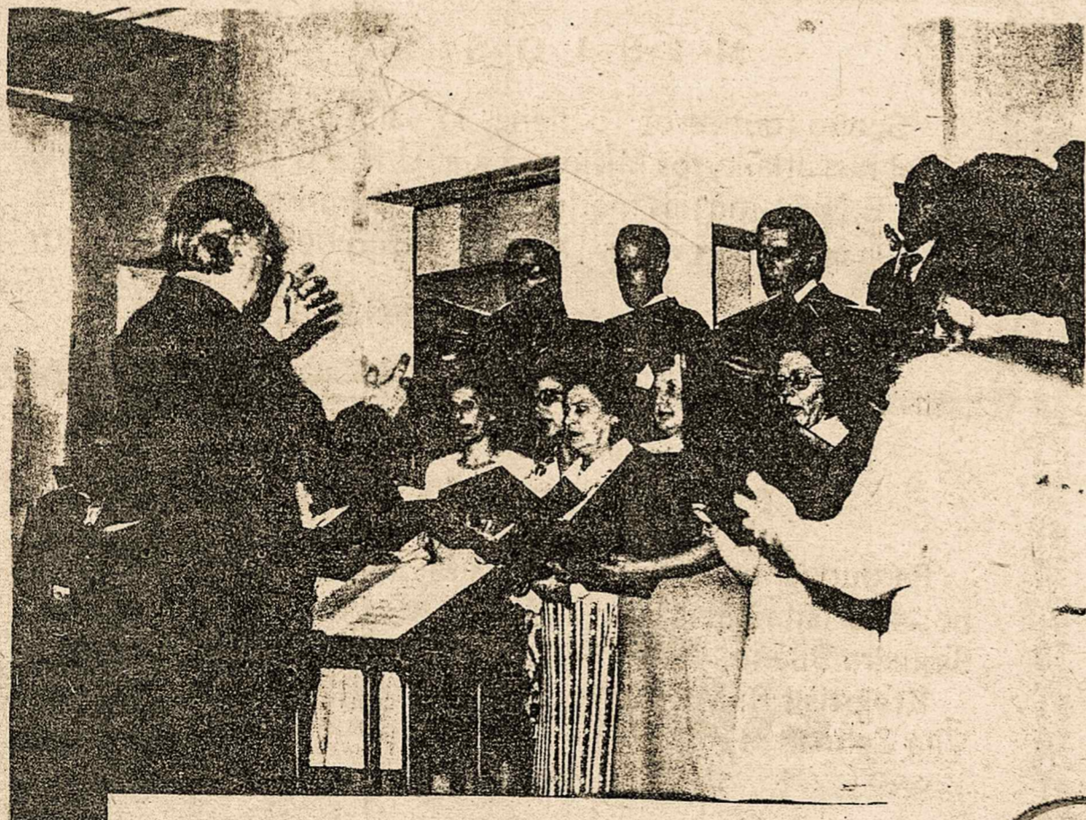
Lietuvių choras Casa Verdės šventėj

Ateitininkai pradėjo repetuoti vaidinimą "Ilgesio Pasaka" su kuriu žada važiuoti į Argentiną ir Urugvajų. Išvyka numatoma sausio mėnesį. Kartu vykti kviečiamas taip pat "Volungės" choras. Vėliau S. Paulyje programa bus parodyta jaunimo šventės proga.