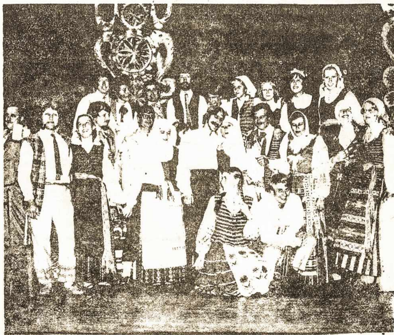
BOSTONO LIETUVIŲ ETNOGRAFINIS ANSAMBLIS

Akademinio Skautų Sąjūdžio Chicagos skyrius kartu su JAUNIMO CENTRU pasikvietė bostoniečius koncertuoti "KAIMO VESTUVES".