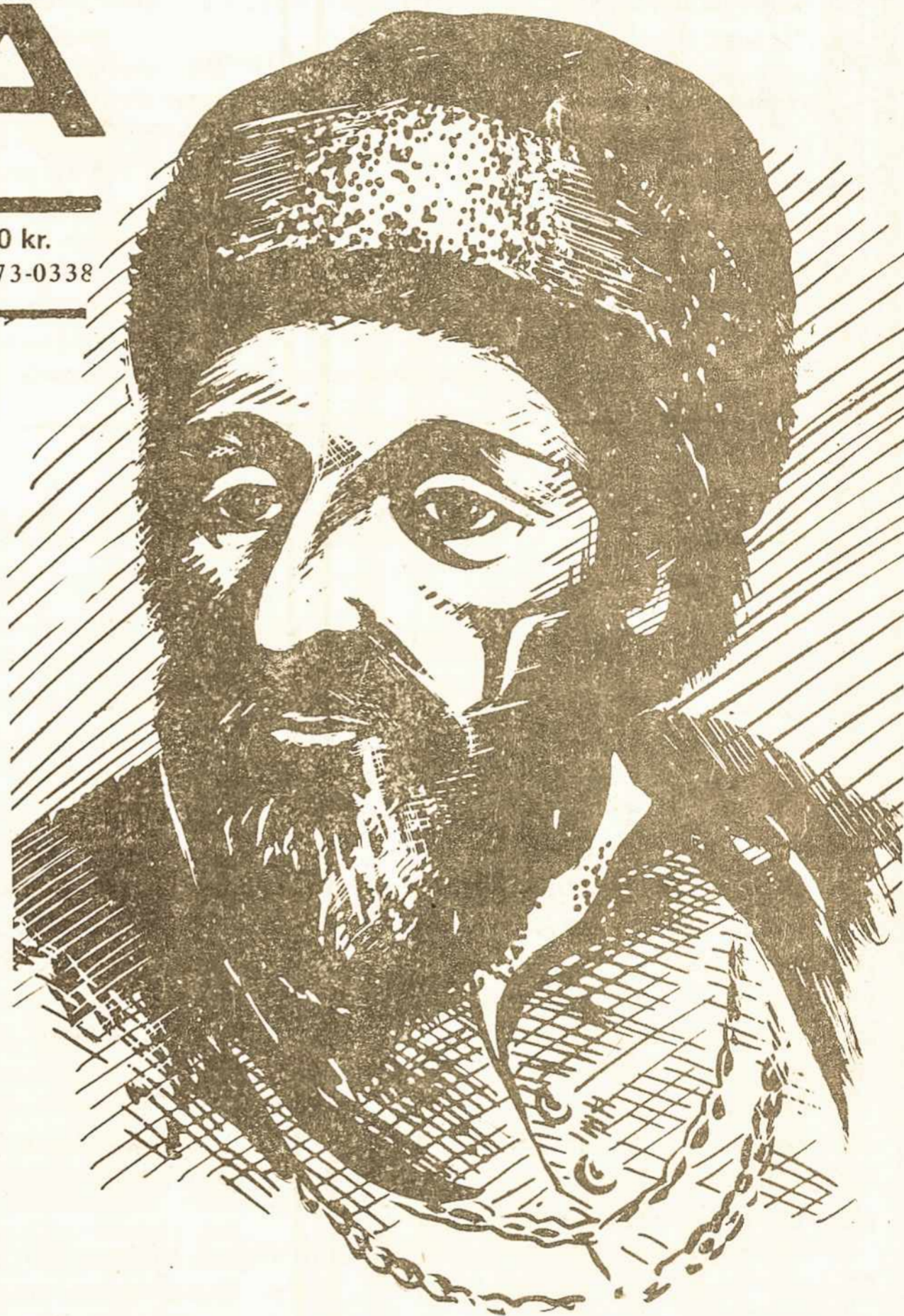
Vysk. Valerijojas Protasevičius, Vilniaus universiteto steigėjas.

V ILNIAUS universitetą, gyvuojantį jau keturis šimtmečius ir skleidžiantį mokslinę bei religinę šviesą, nekartą ištiko tragedija — rusų invazija, lenkų ir vokiečių siautimas. Tai alino, naikino ir marino