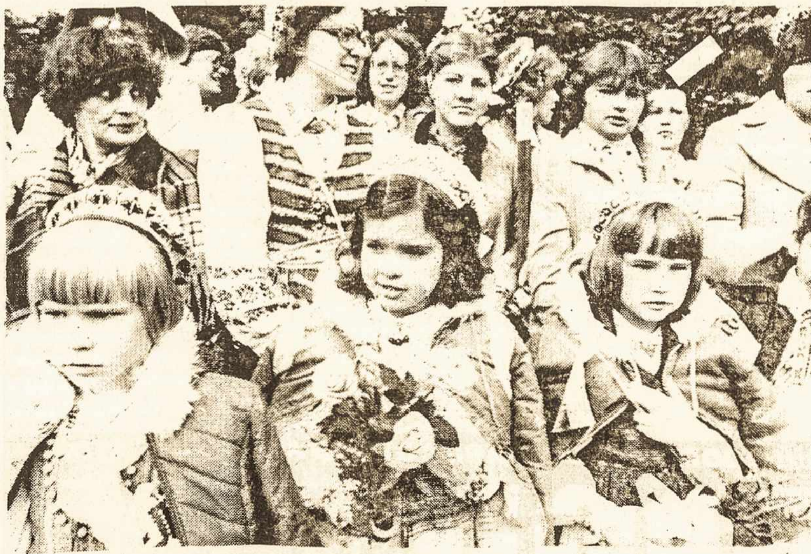
Jaunimas laukia pravažiuojantį Šv. Tėvą Joną Paulių II, Marquette Parke.