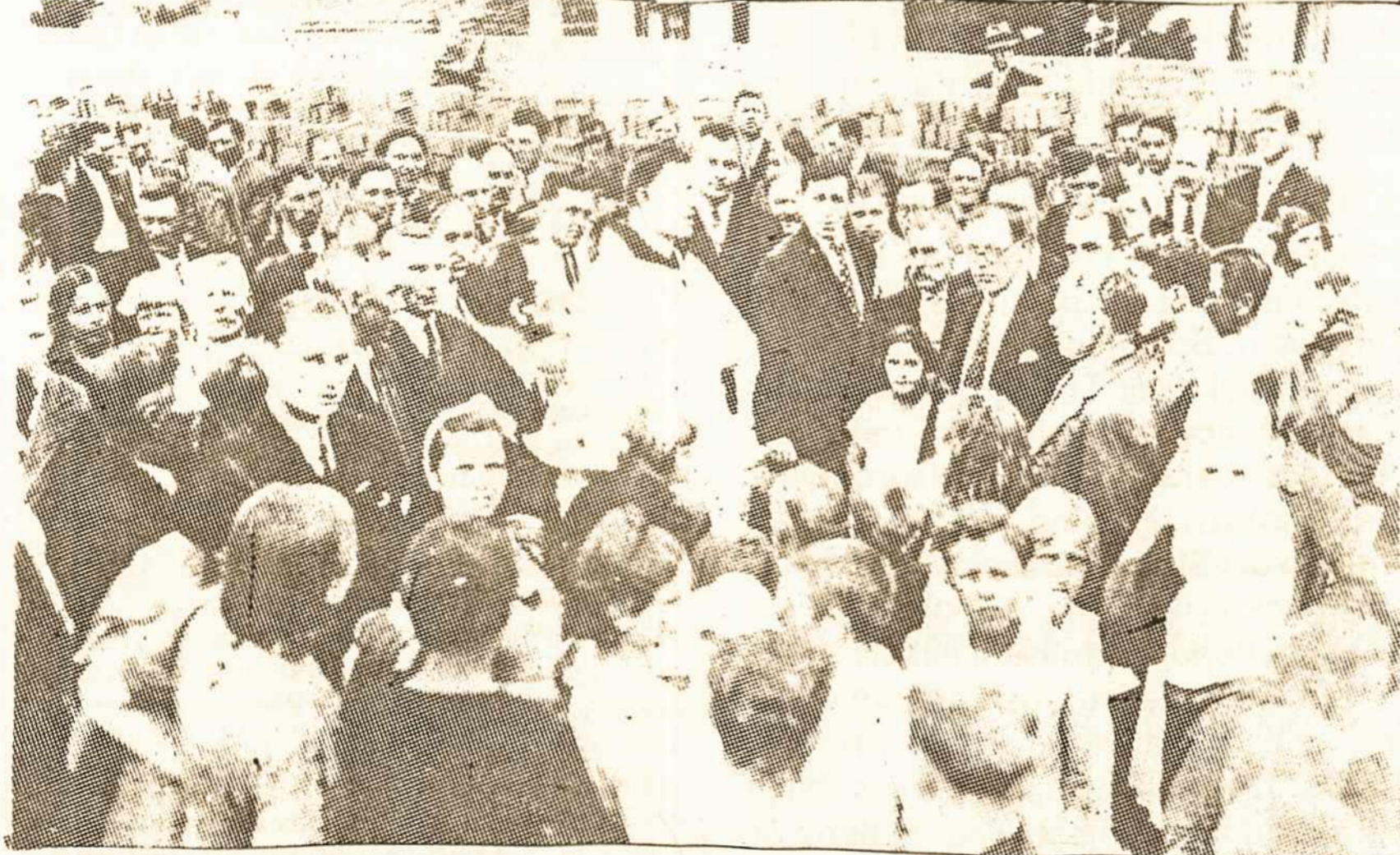
Dr. VINCO KUDIRKOS vardo Rūmų pamatų pašventinimas.