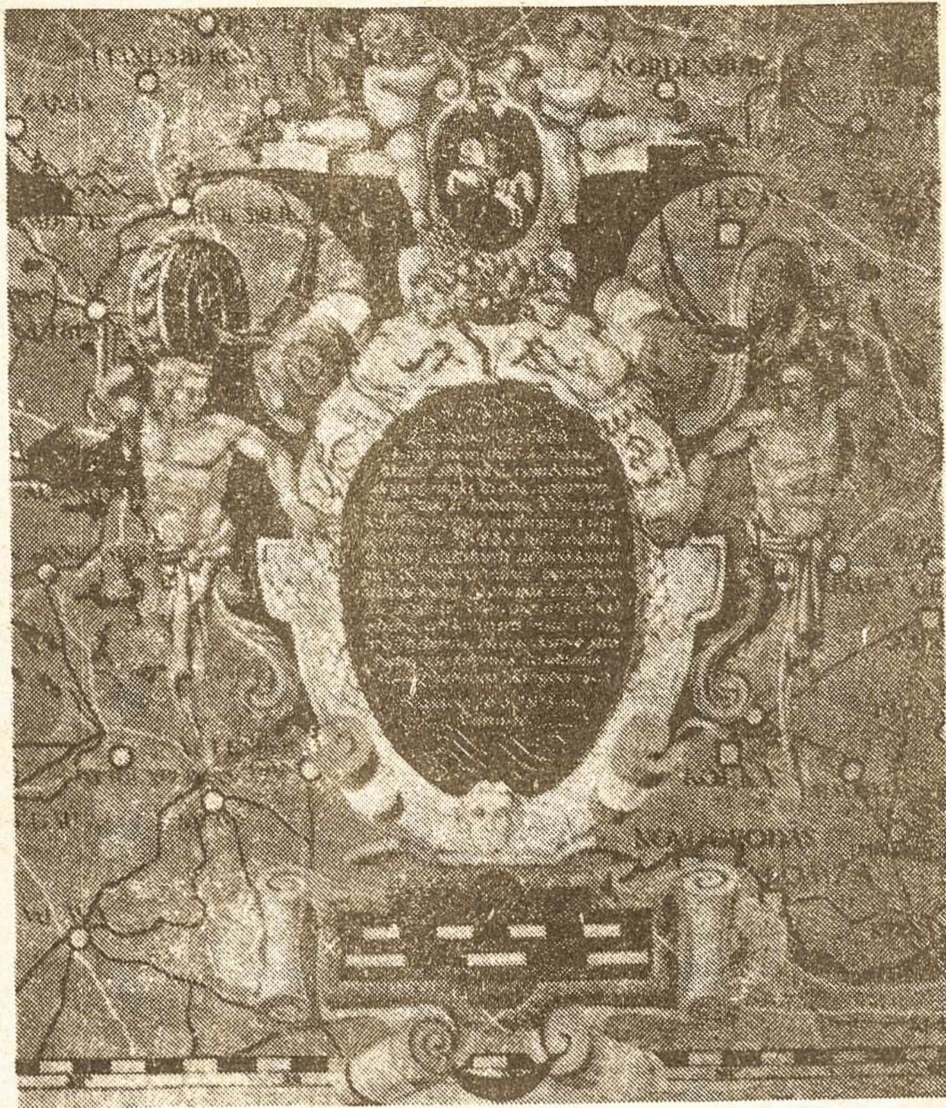
Lietuvos nepriklausomybės akto tekstas ant žemėlapio lietuvių Šv. Kazimiero kolegijoje Romoje, primenantis istorinę dieną

"Nukankintieji kovoja drauge su mumis... Jie stiprina mūsų gretas... Tebus pašlovinti nenusilenkę prieš netiesą." ARKIV. M. REINYS Vladimiro kalėjime