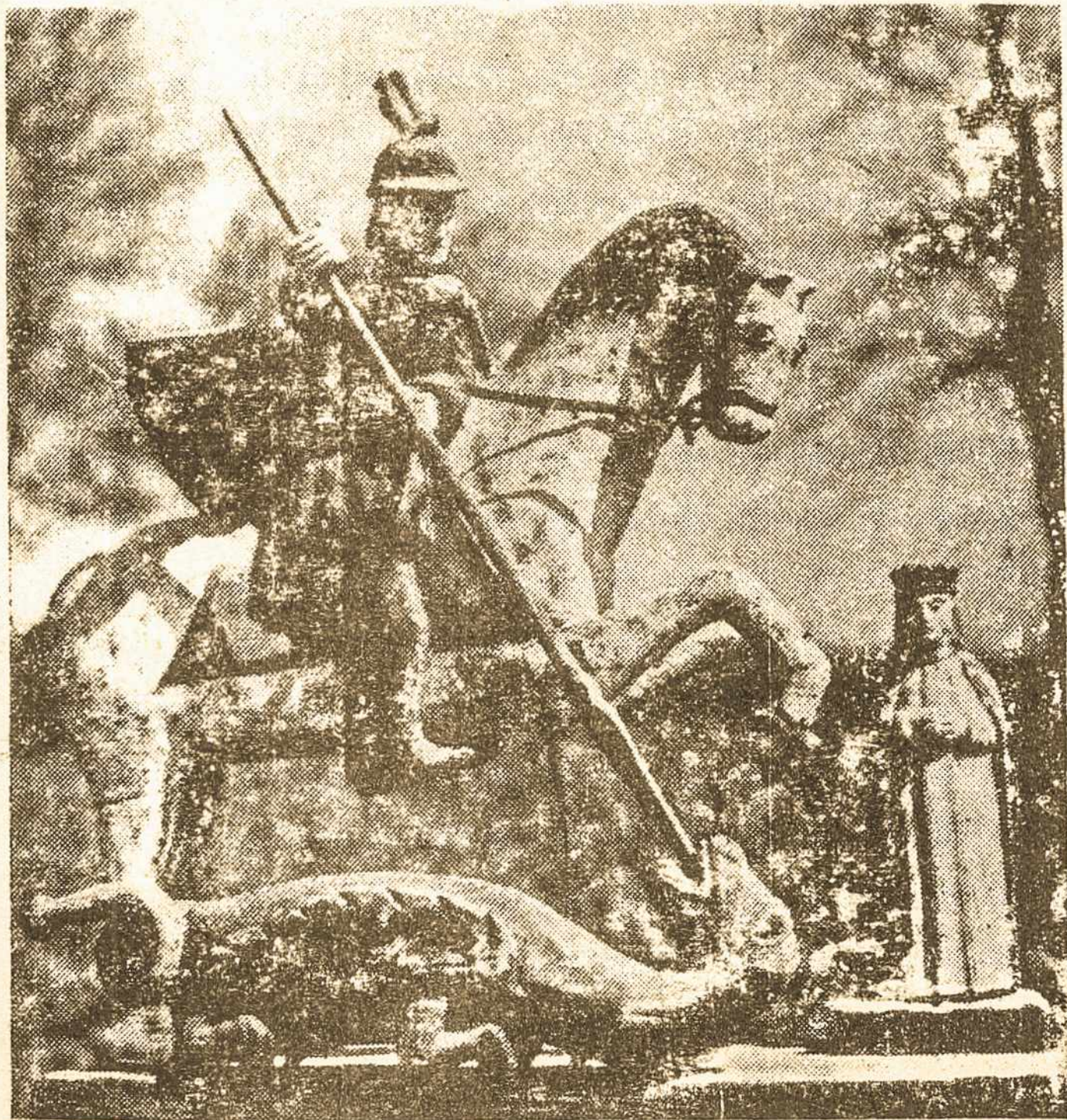
Lietuvos liaudies skulptūra, vaizduojanti kovotoją šv. Jurgio kovą su slibinu