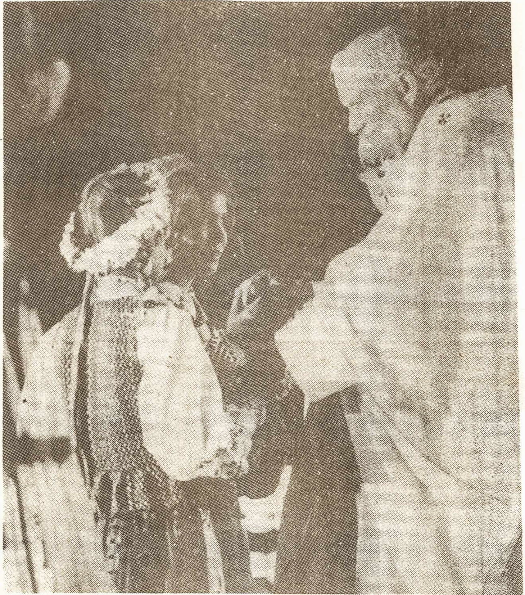
Jaunos Brazilijos lietuvaitėš sveikina popiežių Joną-Paulių II Marakana stadijone