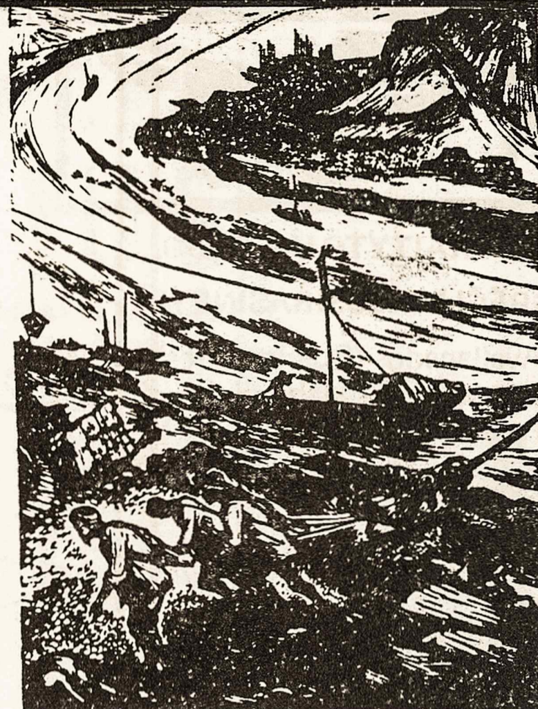
Ant Kialing'o upės Ién Fəng

čiau daug vyrų ir nemažą judėjimą jų tarpe. Neužilgo buvau iš visų pusių apsuptas. Tačiau nė vienas jų nieko blogo man nedarė, nes greit buvau atpažintas kaip misionierius. Sužinojau, jog tai buvo nauji sukilėlių būriai. Jie buvo nutarę tą naktį sudeginti ir sušaudyti nemažą gyventojų. Patariau jiems to nepadaryti, nes tik sau ir nekaltiesiems būtų pakenkę. Pranešiau taipgi, — ko jie dar nežinojo, — kad anam miestely valdžia nuo sukilėlių apsigynė, kad šie, nieko nepesė, buvo priversti pasitraukti. Jie manęs paklausė: tą naktį teko nugirsti tik kelis šūvius, bet nė gaisro nė žudynių neįvyko.