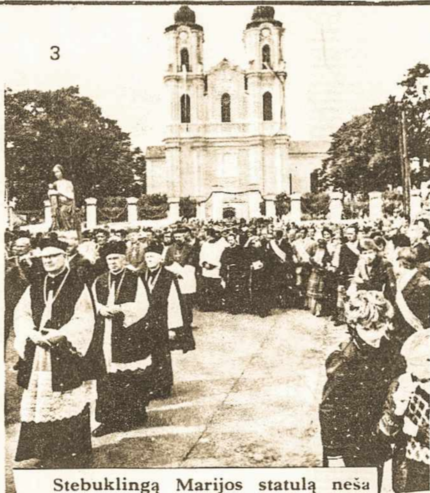
3 Stebuklingą Marijos statulą neša Seinų lietuviai