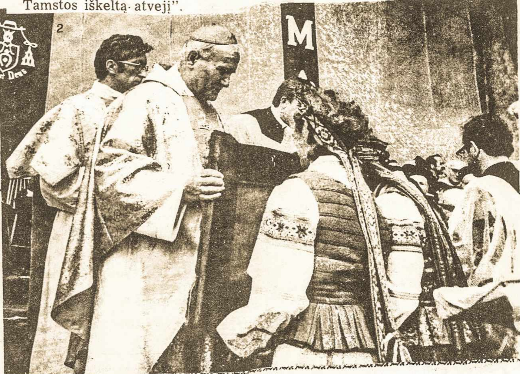
2 Kardinolas Karolis Veityla priima lietuvių dovaną

(manau ir su popiežium, juk tai jis popiežiui pranešė apie mano kelionę į Lietuvą, kuria "Šv. Tėvas džiaugėsi"). Tas pats asmuo VII. 11 vėl rašė, bet jau iš Romos: "Lenkijos Primui susirgus, tuomet negalėjau su juo tarti Seinų reikalų, bet rugpjūčio 5 d. grįšiu į Lenkiją ir stengsiuos pateikti Primui Tamstos iškelta atvejį".