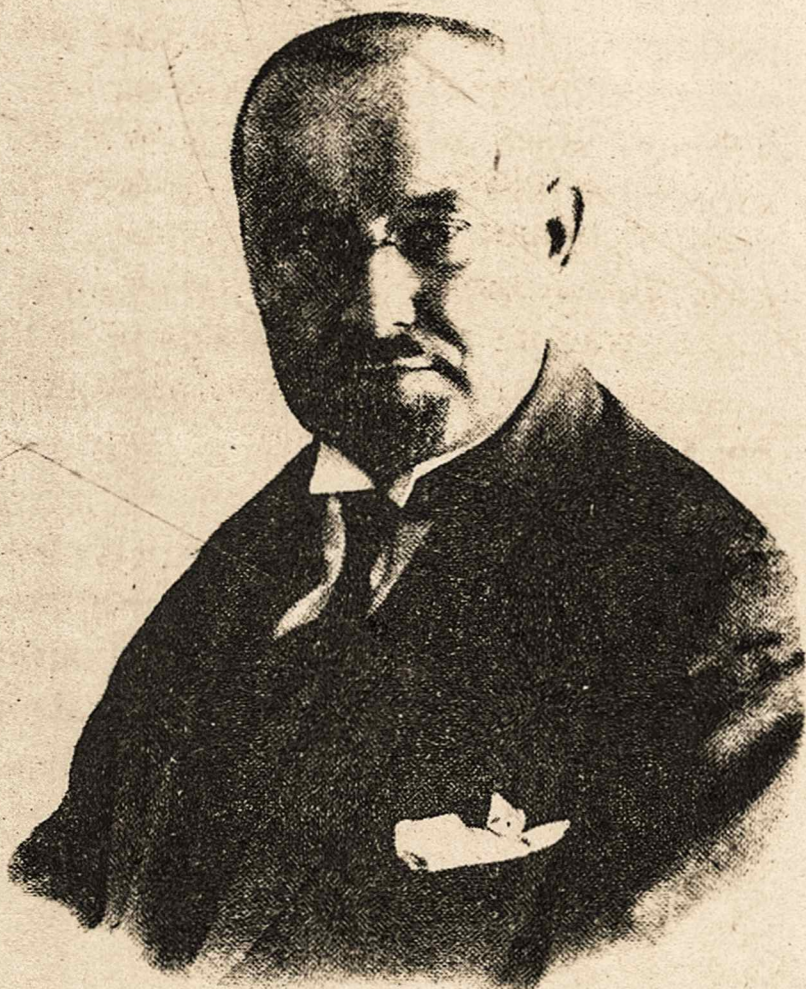
Aleksandras STULGINSKIS (1885 - 1969)

Būdamas emigracijoje, dalyvavo lietuvių visuomenėje, nekarta kalbėjęs per radiją, primindamas pasauliui apie padarytą Lietuvai žalą.