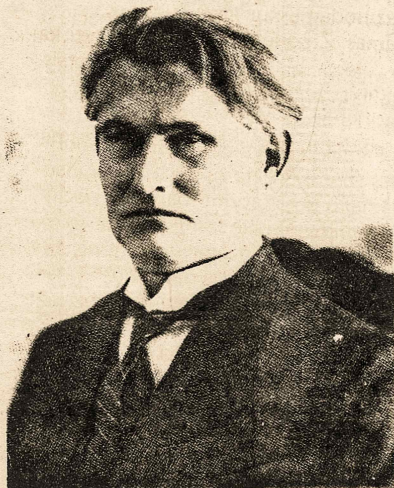
Kazys GRINIUS (1866 - 1950)

ir jo žmona buvo areštuoti ir deportuoti į skirtingas Rusijos vietas. Po Stalino mirties buvo leista jiems sugrįžti į pavergtąją Lietuvą. Gyveno Kaune, palaiduotas Petrašiūnuose.