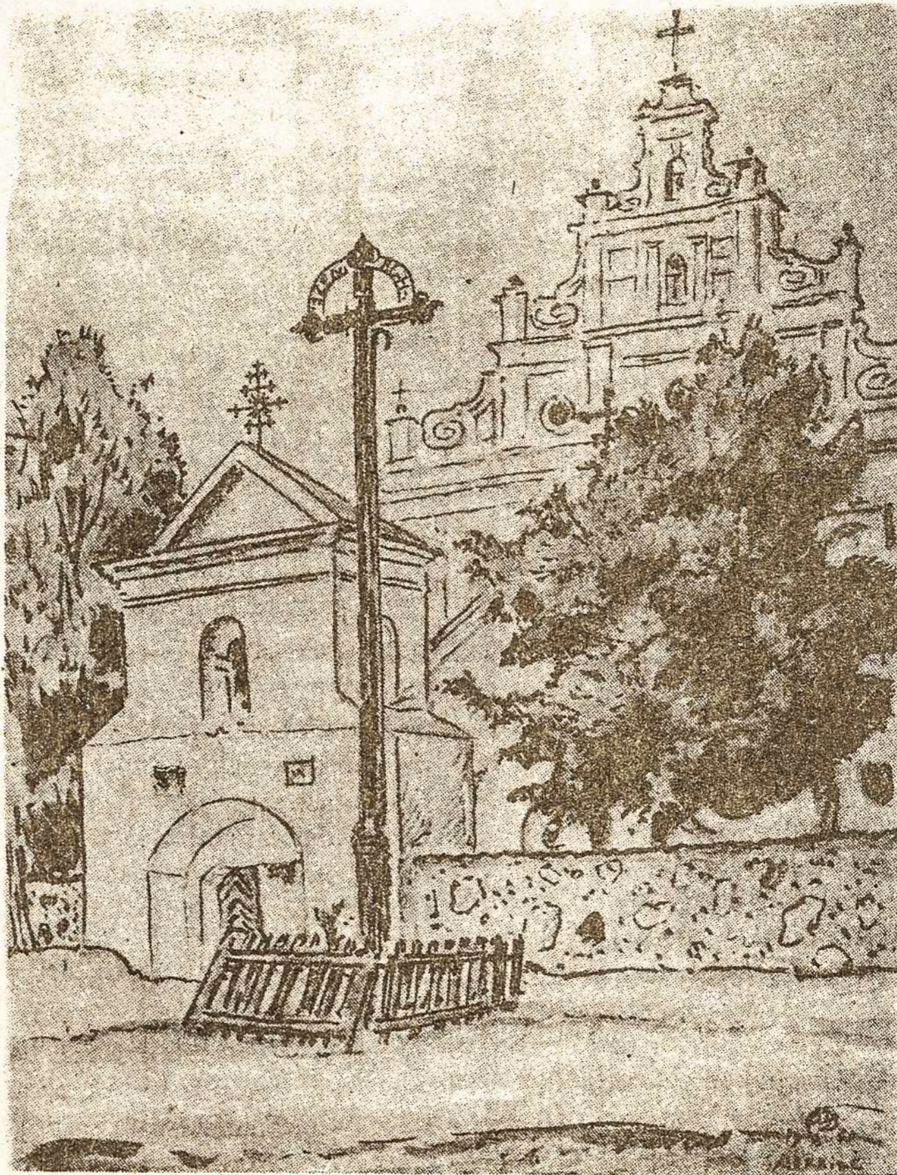
M. Dobužinskis (1875-1957)