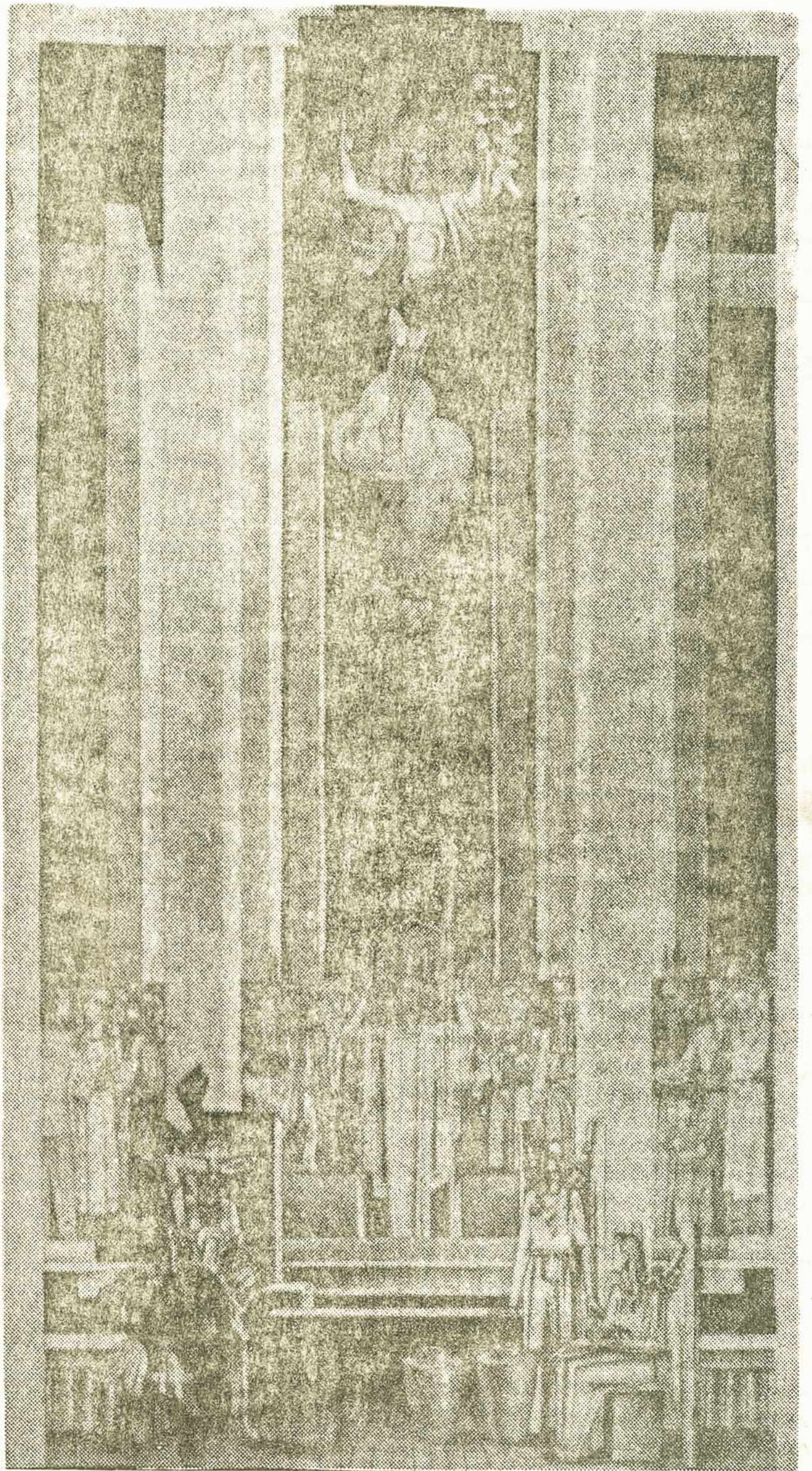
KRISTAUS PRISIKĖLIMAS — dailininko K. Varnelio projektas Prisikėlimo šventovės vitražui Kaune (30 x 15 metrų). Šioje šventovėje sovietinė valdžia įrengė radijo priimtuvų gamyklą, ir projektas liko neįvykdytas.

Lietuvos nacionalinė M. Mažvydo biblioteka