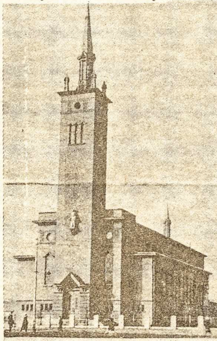
Naujoji Klaipėdos katalikų bažnyčios baigta statyba 1960 m.

Ankštutėliame maldos namelyje, kur dabar renkasi tikintieji, žmonės dažnokai alpsta per pamaldas, bet valdžios organai lieka kurti bet kuriems prašymams grąžinti Taikos Bažnyčią.