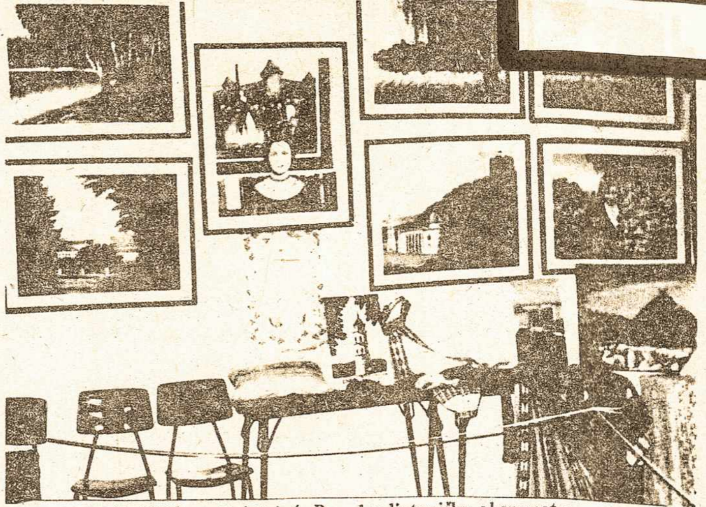
Dalis 1978 m. Kultūrinės Parodos lietuviškų eksponatų.