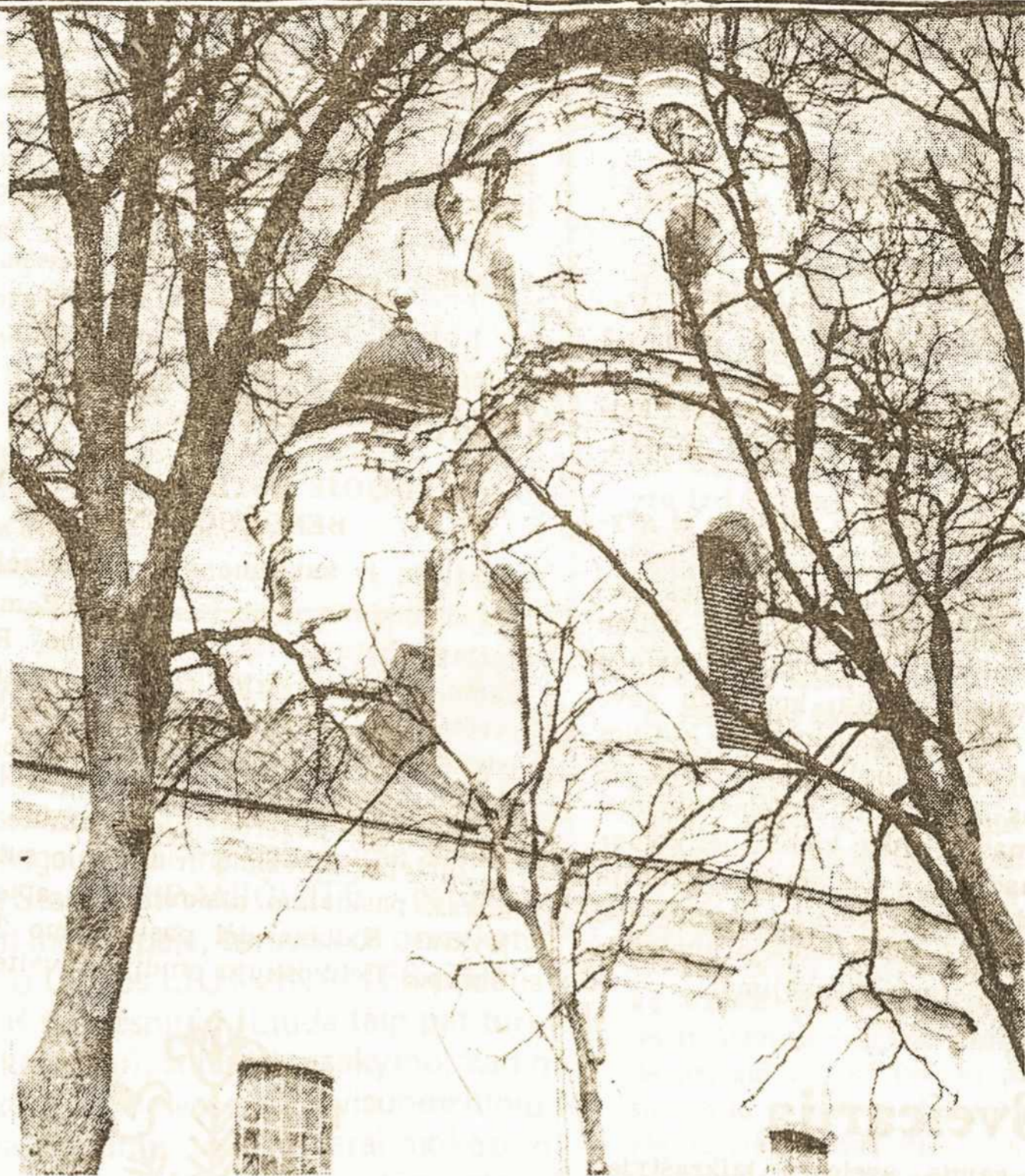
Seinų katedros bokštai 1981 m. Šioje Sūduvos lietuvių šventovėje Lomžos vyskupas neleidžia melstis lietuviškai (iš "Lietuvos bažnyčių" II tomo).

Noriu dargi Jus informuoti, kad čia, São Paule, turim asmeninę lietuvių parapiją. Čia kasdien laikomos Mišios lietuviškai pačioje parapijos būstinėje, o sekmdieniais — 11-koj kity vietovių, nes lietuviai yra pasklidę po visą 12-kos milijonų didmiestį. Šios pamaldos laikomos lietuviškai pačių brazilų bažnyčiose ar koplyčiose: čia žmonės meldžiasi, gieda, atlieka visas savo religines apeigas lietuviškai. Pasitaikius reikalui, kviečiamas lietuvis kunigas ir šokiadieniais — ligoniams, laidotuvėms, sutuoktuvėms, krikštui ir pan. — Tokias tautines parapijas, ar misijas, turi ir visos kitos etninės grupės: lenkai, slovakai, vengrai, vokiečiai, kinai, japonai... kur visos apeigos atliekamos jų gimtąja kalba. Taip vyksta ir kitose šalyse.