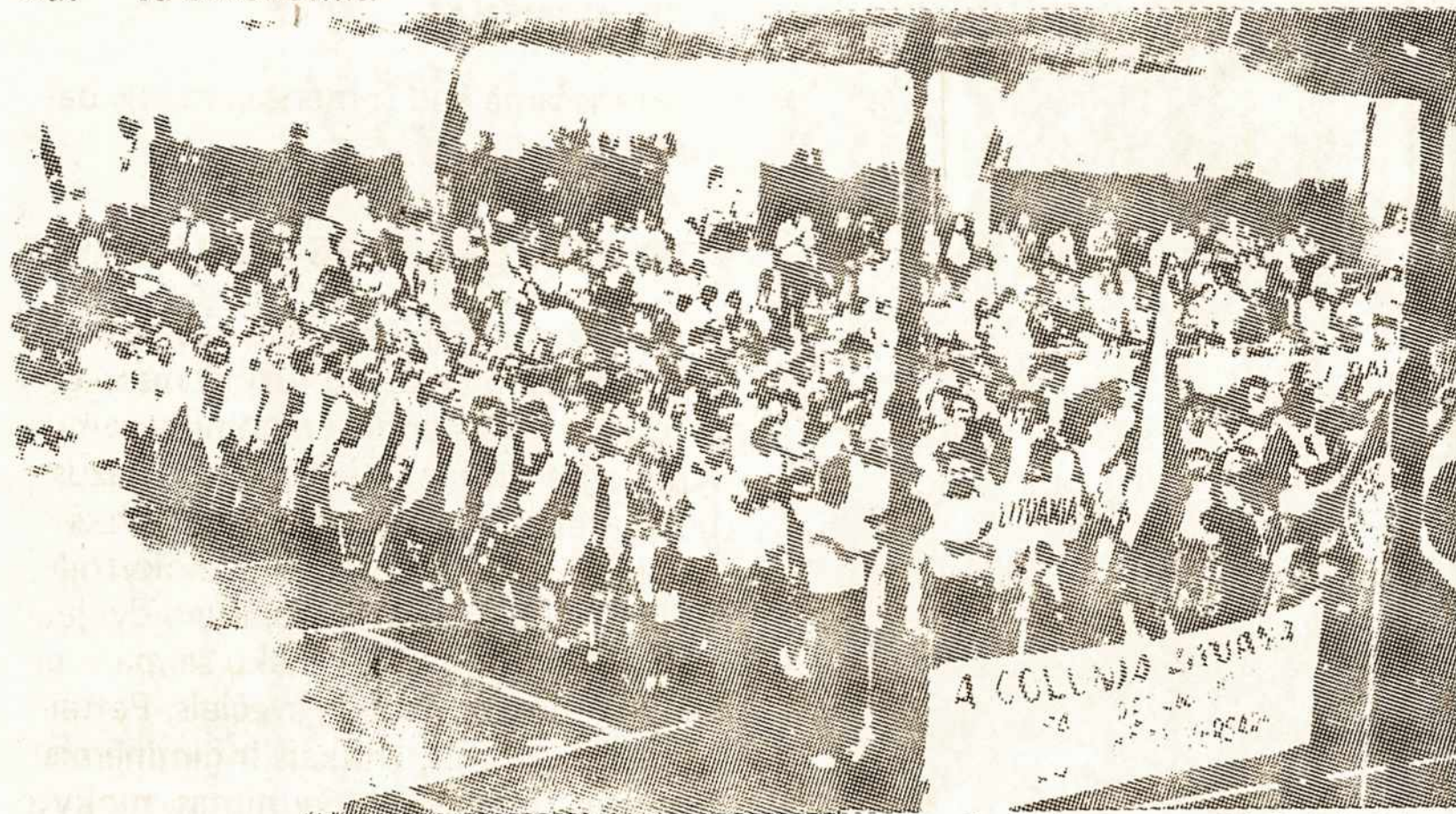
Fotografijoje matosi lietuvių delegacija.