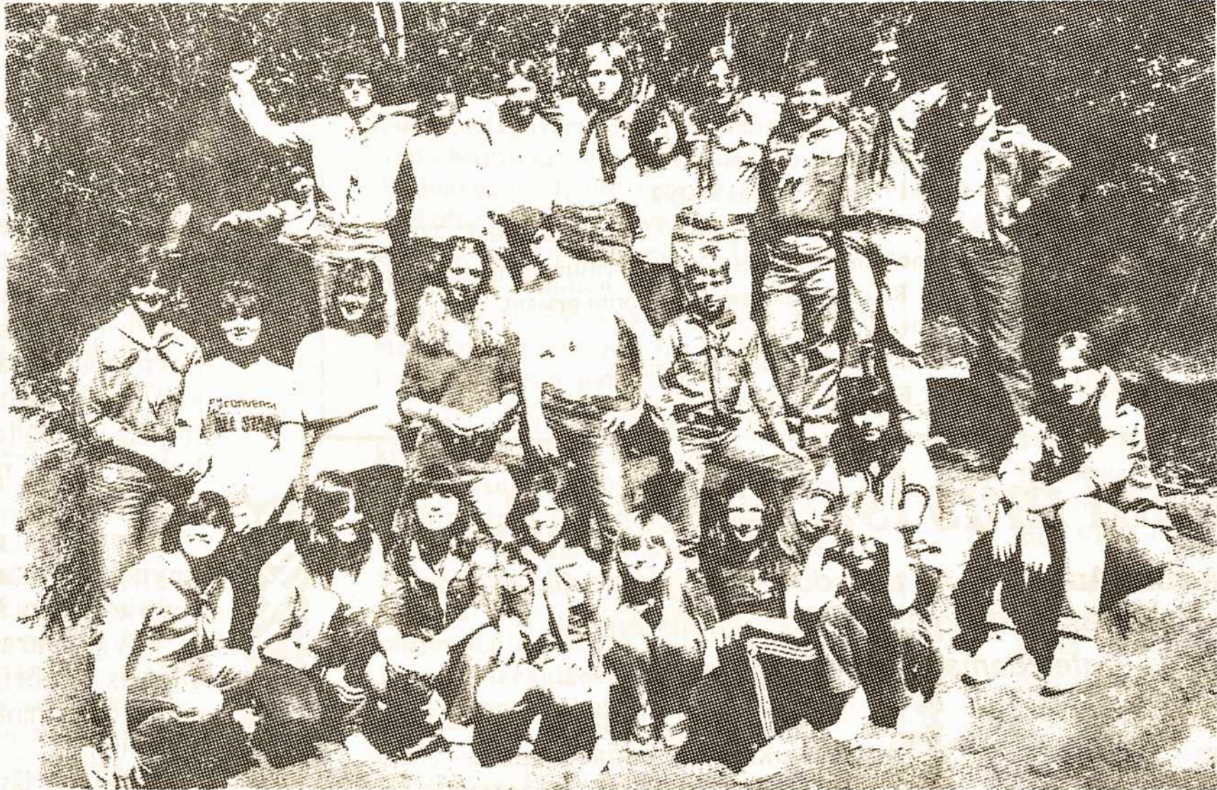
Palangos skautai stovykloje Lituanikoje.