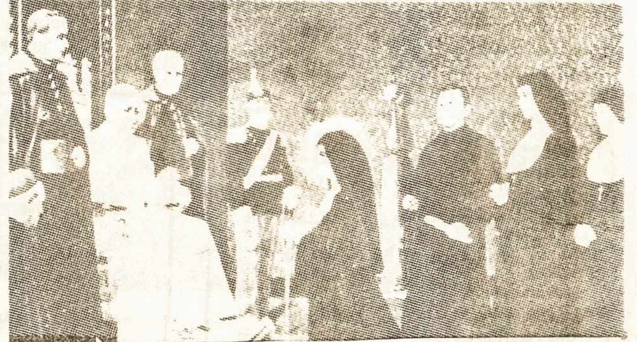
Em 1877 as primeiras seis FMA partiram para as missões. Me. Mazzarello acompanha-as numa visita ao Papa (Quadro de Crida).