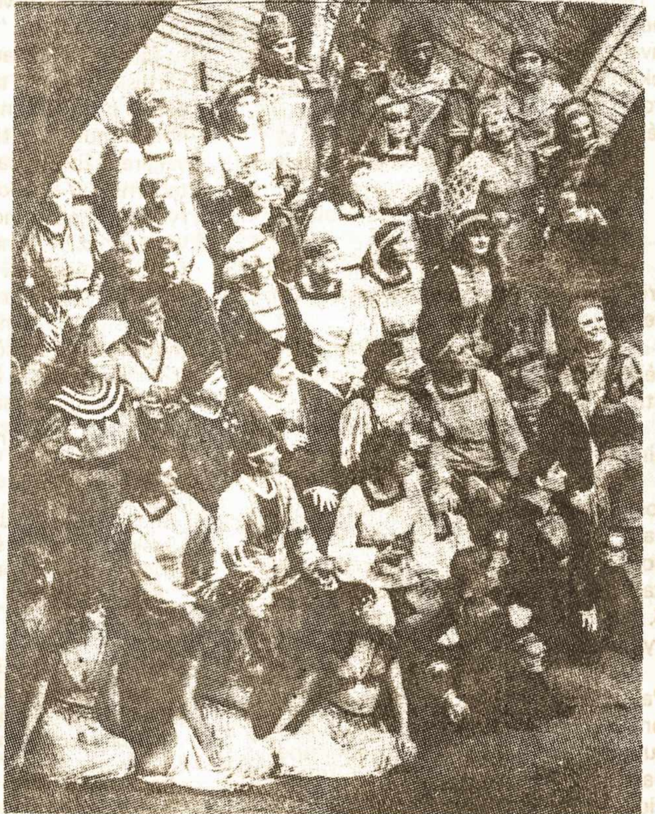
Choro ir baletu grupė "Lietuviuose" antrajame veiksmė, Marienburgo puotos metu.

S TIPRI mūsų išeivijos jungtis yra tikiškinė Bendrija. Istorinio likimo dėka dalykai taip susiklostė, kad lietuvių tauta tapo katalikiška ir iš dalies protestantiška. Seniau Lietuvoje ir išeivijoje tikiškinis pradės, kaip tautos jungtis, nebuvo visu šimtu