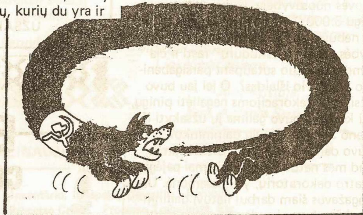
Sovietų Sąjungos ir Lenkijos žaisminga ideologinė draugystė, lenkiškojo komunizmo esencijai susikoncentravus į uodegą.

Ir komunizmas, išplitęs Europoje ir Azijoje, pradeda skilti, virsdamas atskirais luitais, besitrinančiais vienas su kitu. Jau imta aižti paviršius, jau čiurlena laisvos minties disidentinio pasipriešinimo srovelės... O kiek skilimų gelmėse – nematomų, nepastebimų. Kiek sušutimo, supuvimo, korupcijos nuo viršaus iki apačios visame komunizmo ledyne. Jis – ištirps.