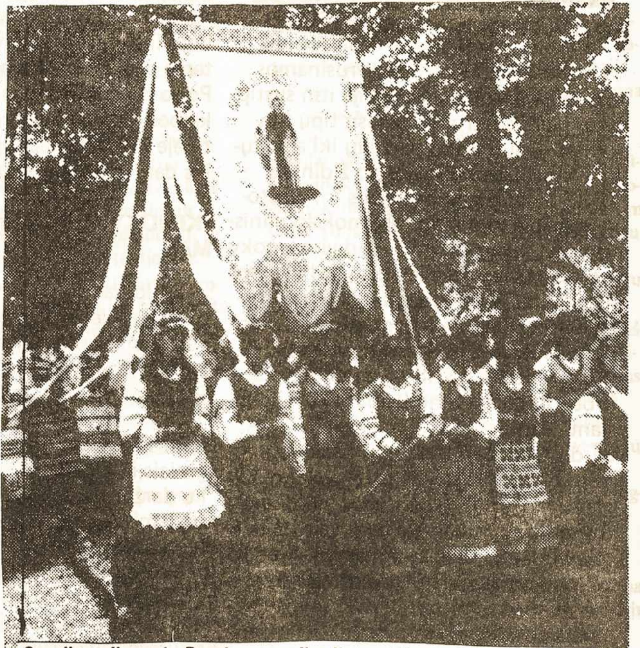
Suvalkų trikampio Punsco parapijos lietuvių, apsirengusių tautiniais drabužiais, dalyvauja procesijoje su šv. Jono Bosko vėliava, kurioje yra įrašas: "Vesk skaisčiais keliais jaunimą"

Vokietijoje). Ją reikėtų centralizuoti, nes dažnai ta pagalba pasinaudoja nelietuviai. — Skubios pagalbos reikalingi Gudijos lietuviai. Jau kelintą kartą jie apeliuoja į pasaulio lietuvius, prašydami paramos kultūrinėje kovoje. Ten vykdoma nežmoniška kultūrinė priespauda. Jei nėra kitų kelių, reikia kelti šį klausimą bent tarptautinėje plotmėje, gudų išeivijos organizacijose, spaudoje. Tai vienas opiausių pagalbos barų šiuo metu. Mažiau opus baras yra V. Europa, kur lietuviai turi dar nemažai kultūrinių pajėgų, nors Vasario 16 gimnazija reikalinga nuolatinės paramos. Dėmesio reikalinga ir P. Amerika, bet ten jau dirbama, kai kur stipriau pajudėjo vietinės jėgos. Belieka testuoti tai, kas pradėta. Linkėtina, kad Pasaulio Lietuvių Bendruomenė, atsirėmusi į Š. Amerikos lietuvius, telktų įmanomą pagalbą visuose minėtuose baruose.