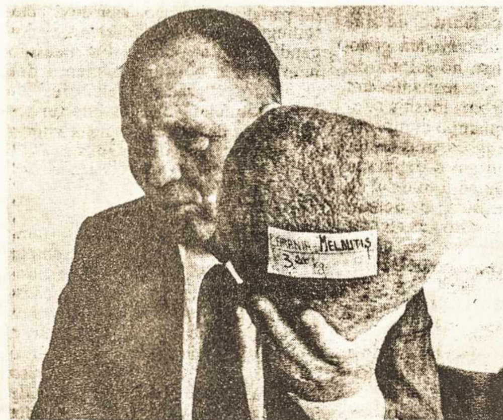
Laranja encontrada na Amazônia pesa 3,2 quilos

Meldutis declarou também que é proprietário de uma tartaruga de 800 anos de idade, que ele adquiriu de um índio pela troca de um anel de formatura.