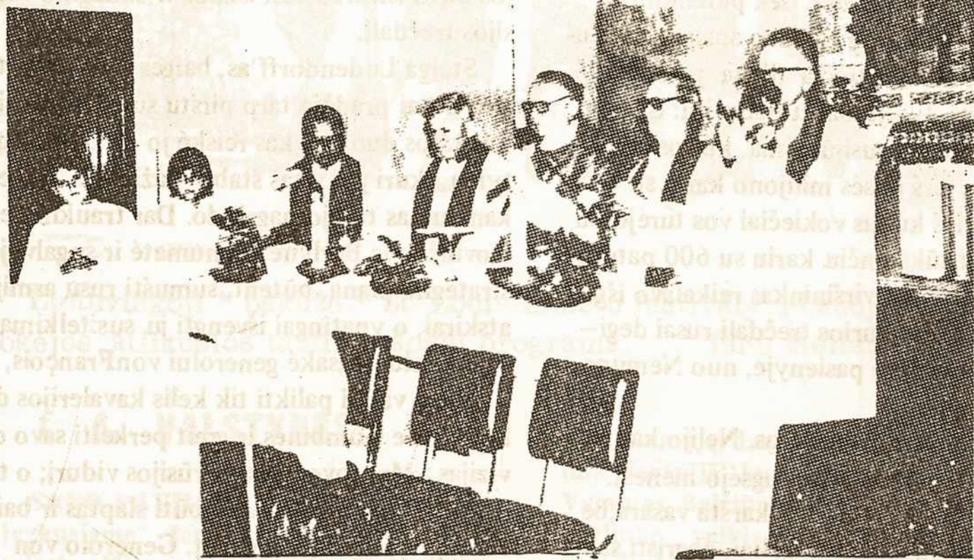
Jubiliejaus koncelebracija V. Zelinos bažnyčioje

Pirmasis pas mus auksinis kunigystės jubiliejus lieka dabar aukso raidėmis įrašytas į São Paulo ir Brazilijos lietuvių istoriją. Įvykis liko neužmirštamasis ypač