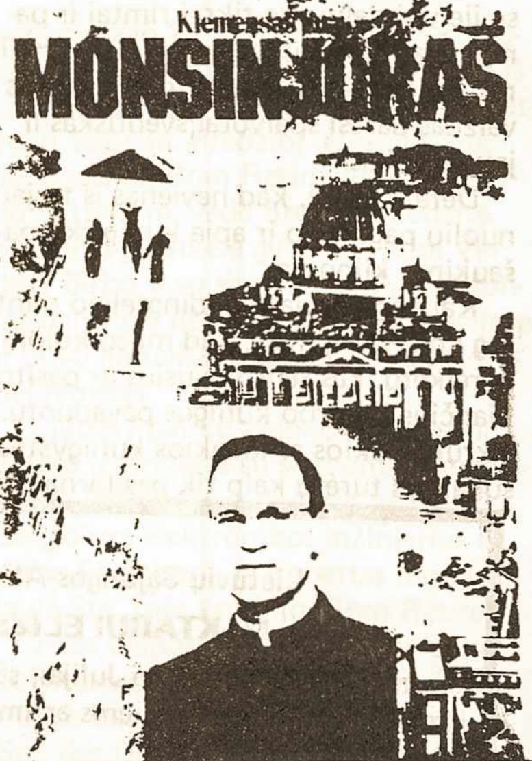
Klemensas Jūra, MONSINJORAS. Spaudė Pranciškonų spaustuvė. Brooklyn, 1979 m., 382 psl. Tiražas — 1.000 egz. Kaina: Cr.500