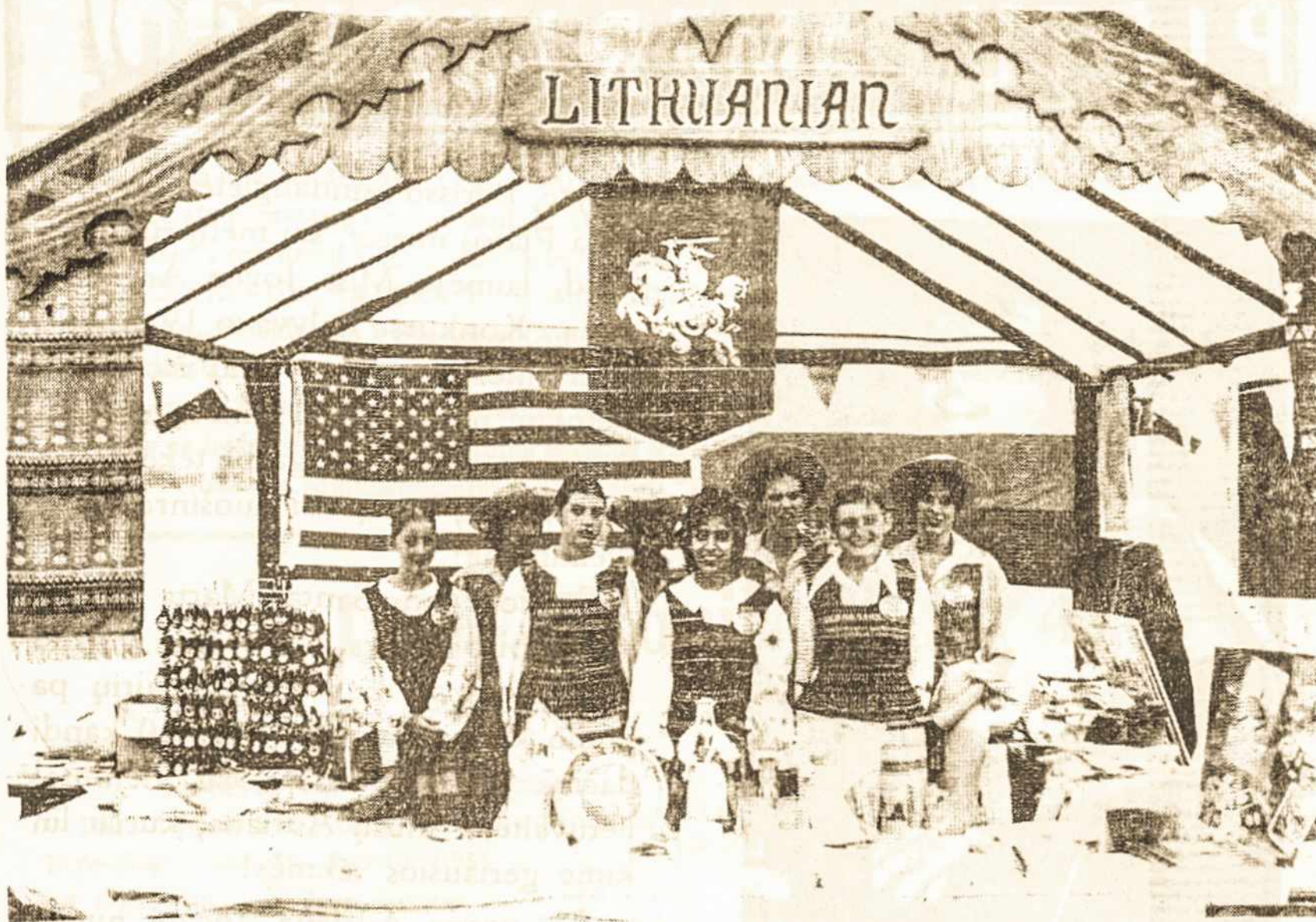
Lietuviškoji "bakūžė" St. Louis miesto festivaly. Pozuoja Civic Center šokėjos, atlikusios tautinių šokių programą.