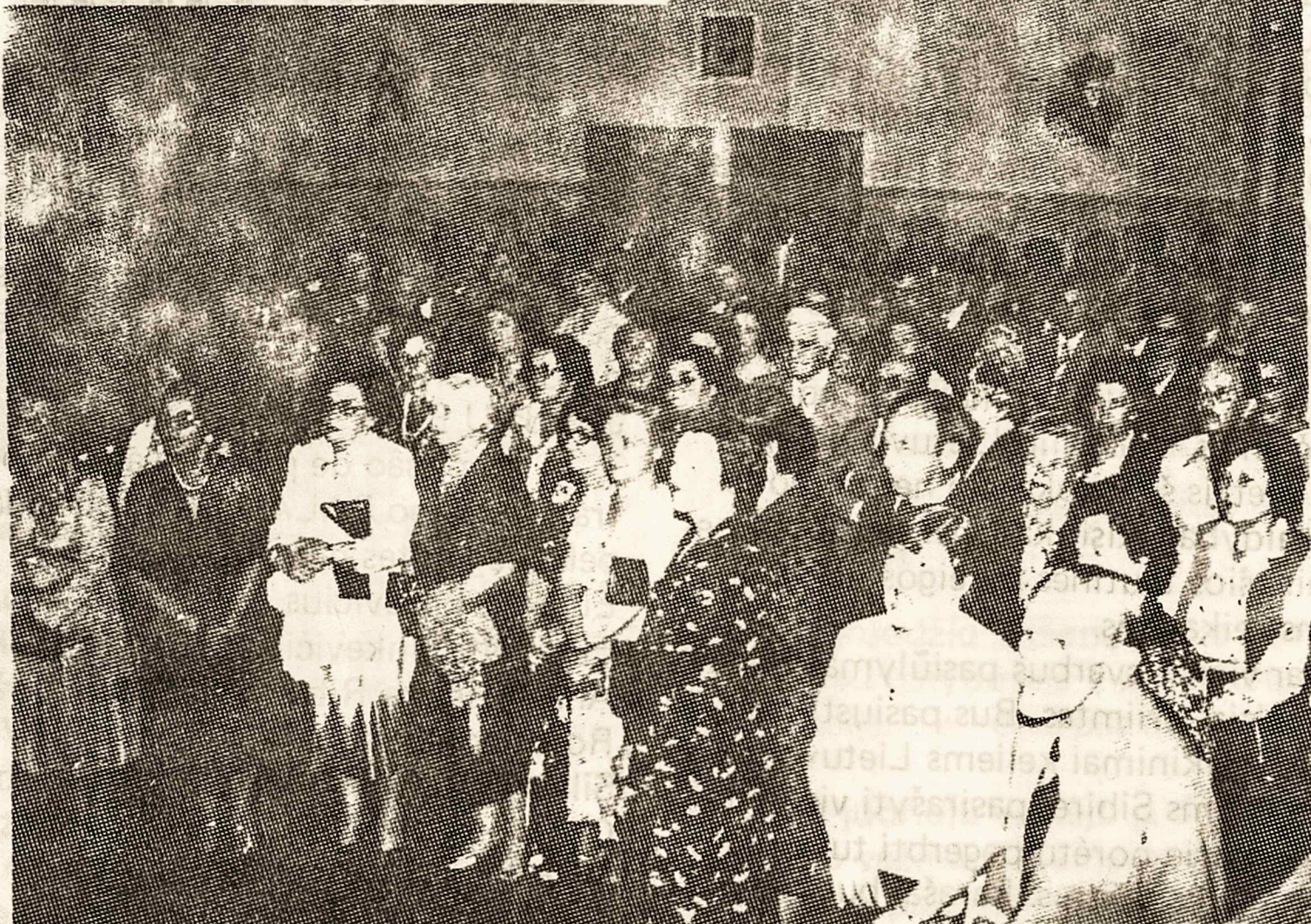
Dalis publikos Sąjungos-Aliança šventėje.