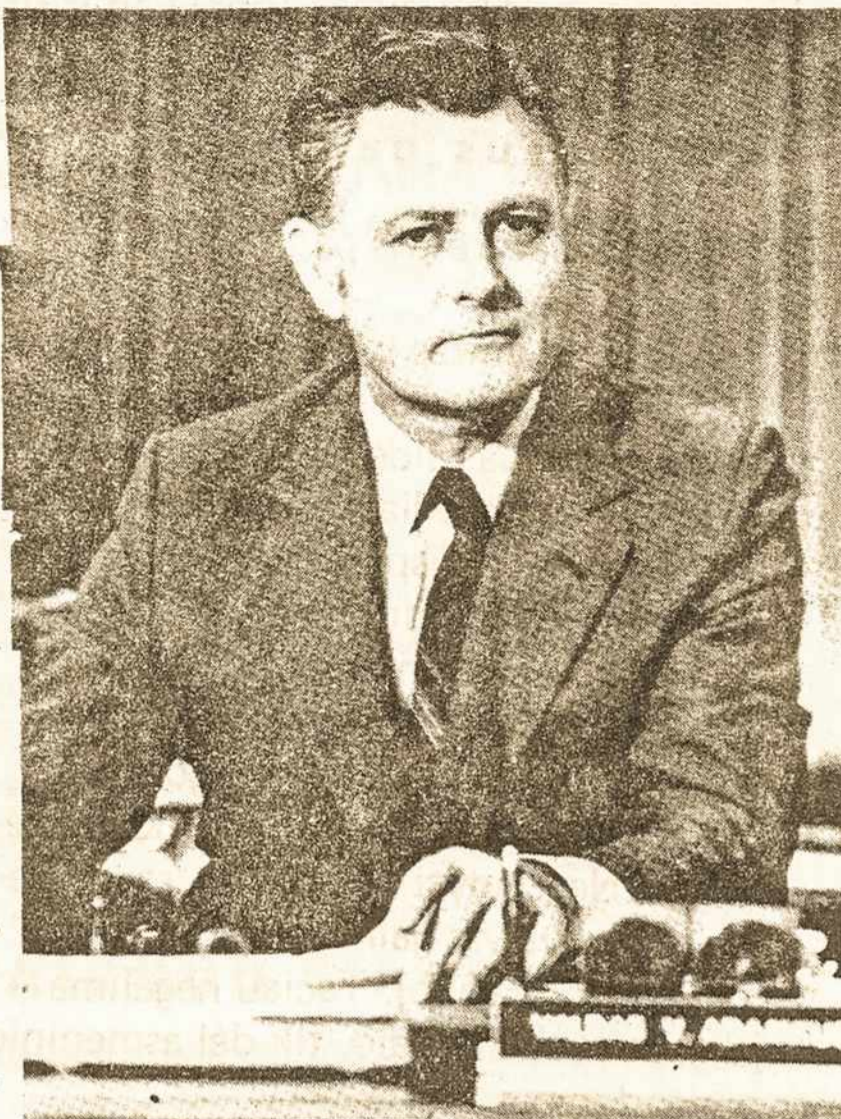
Valdas Adamkus – ŠALFASS - pirmininkas 15