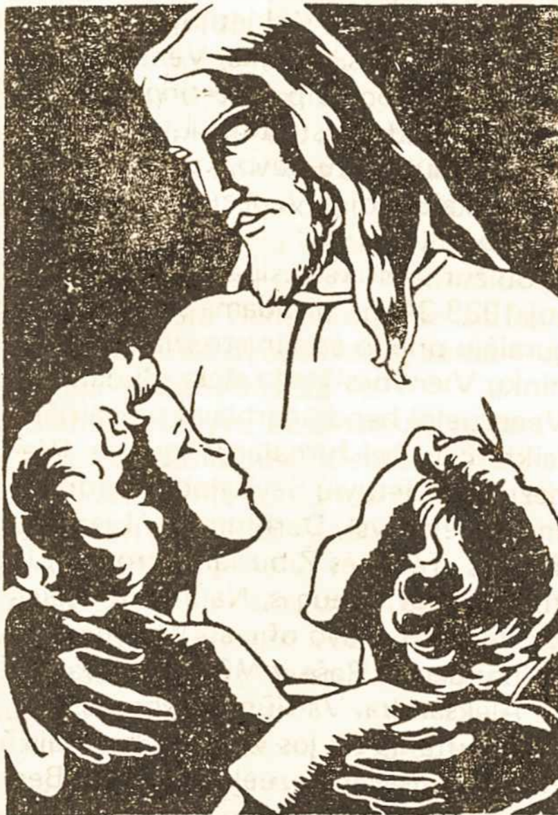
Ar tu nenori būti mano bendradarbiu?

– Ar tai man svarbu? Ar aš tuo rūpinuosi? . . .