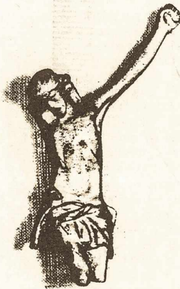
LIETUVA NUO 1940

Ryte, iš Vilniaus atvyko du asmenys: jaunas vyras ir moteris. Pirmasis – tikriausiai čekistas, o moteris – milicijos vaikų kambario inspektorė. Moteris kalbėjosi su jaunimu, o