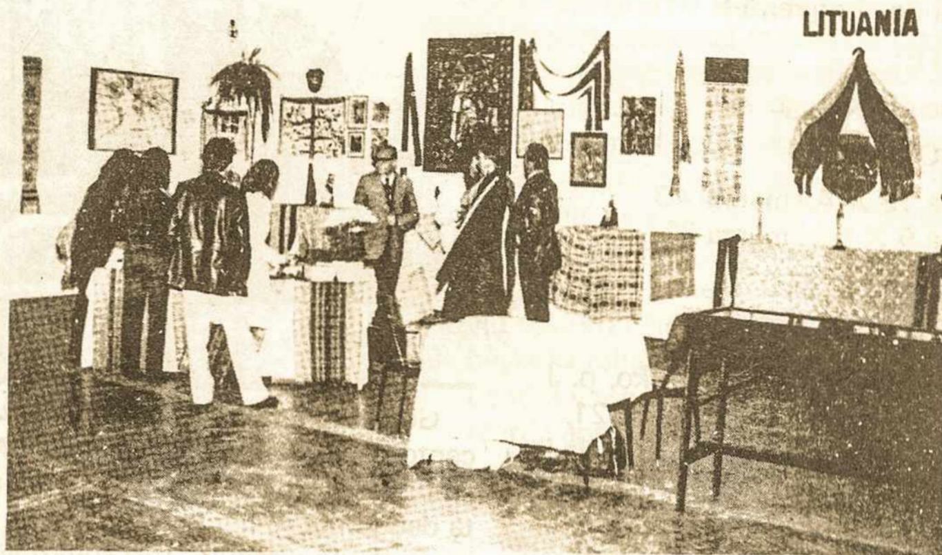
Lietuvių kampelis imigrantų parodoje Sao Paulo Brazilijoje.