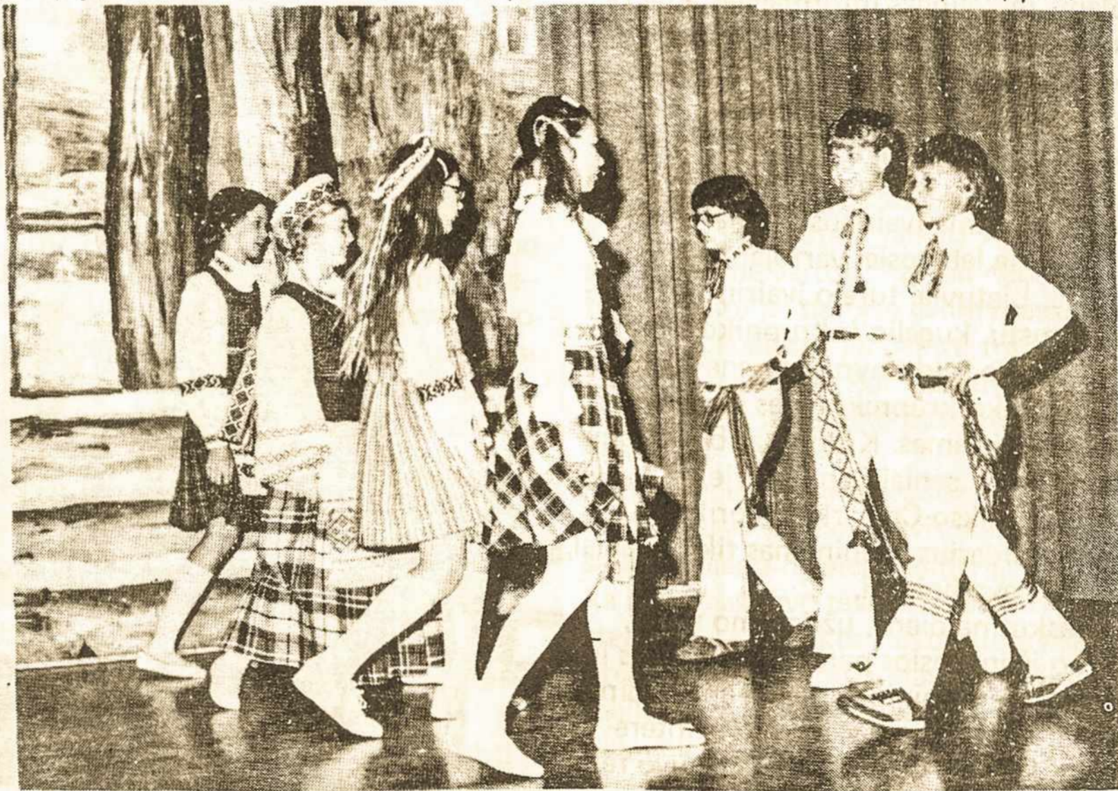
Kr. Donelaičio pradinės mokyklos, 6-jo skyriaus mokiniai šoka Kalėdų eglutės metu, gruodžio 19 d.

Organizacijos savo formaliame išoriniame veikime palaiko lietuviškumo šydą, nes sueigos, susirinkimai vyksta lietuvių kalba. Tačiau šalia stovinčių vyresniųjų pastabos apie į priekį išėjusį jaunuolį, kritikuojančios jo akcentą ar klaidingą linksnį, užmuša iniciatyvą ir atstumia tuos, kurie mielai sektų vyresniųjų pėdomis. Sportininkai tarpusavyje kalba angliškai. Tą patį daro ir tautinių šokių grupių dalis. Vis dėlto rezultatai yra neblogi. Jaunuoliai, dalyvaujami tokiose grupėse, jaučiasi esant tautos dalimi. Ne žodžių taisyklingu vartojimu išliksime lietuviais. Taisyklingai kalbama okupuotoje Lietuvoje. Svarbu išlaikyti savo dvasią ne vien lietuvišką, bet ir humaniškai šiltą, kad neprarastume tų, kurie mielai liks mūsų tarpe, jeigu jiems nestatysime per daug didelių (nukelta į 7-tą psl.)