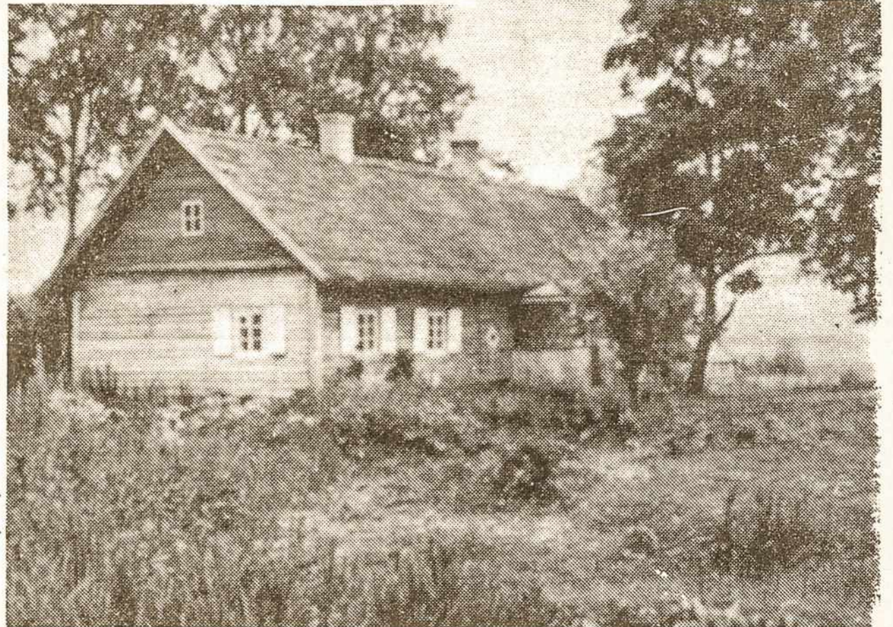
Smagu ir sveika buvo Lietuvos laukuose?