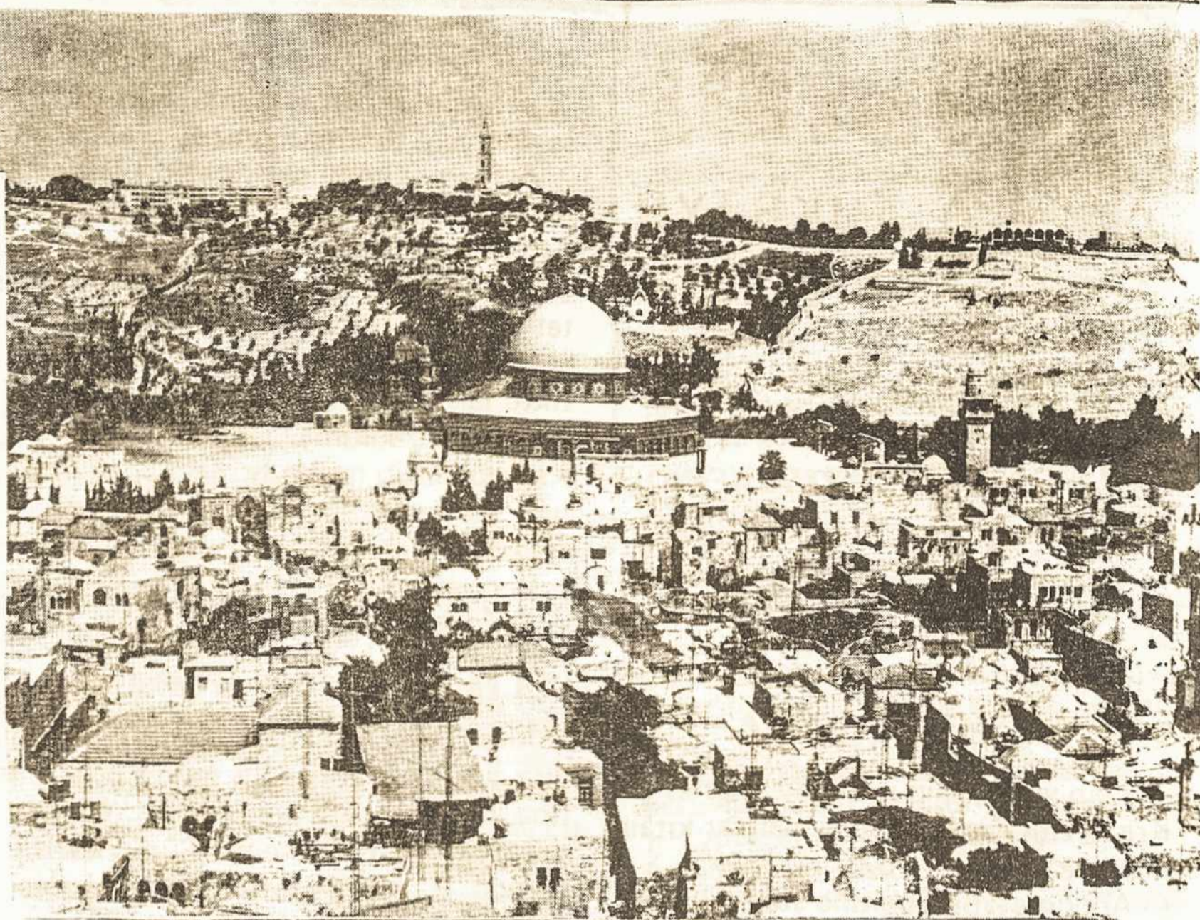
Jeruzalės senamiesčio vaizdas su arabų šventove (uolos kupola). Ši šventovė yra maždaug 50 pėdų nuo buvusios Jeruzalės šventyklos, kurios net griuvėsių labai mažai belikę.

Aplankiau Betliejaus apylinkėje esančią piemenėlių pakriautę. Čia buvo girdima angelų giesmė – Gloria in excelsis... Toje vietoje yra pastatyta bažnyčia. Vėliau gi nuvykau užkopti į Herodijanumą, 5 mylios atstu nuo Betliejaus. Čia karalius Herodas buvo pasistatęs sau rūmus ir kur jis buvo palaidotas aukso karste brangakmeniais papuoštame. Prie Herodijanum sutikau didelę maldininkų ekskursiją iš Čilės – Pietų Amerikos (250 asmenų). Jų tarpe buvo 12 kunigų, su kuriais pasikalbėjau ispaniškai. Jie man sakė, jog dviejų savačių kelionė orlaiviu su viešbučiais jiems atsiėjo po USA$ 2.500,00.