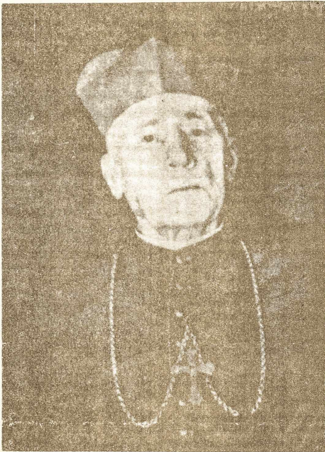
Arkivyskupas Teofilus Matulionis (1873.VI.4–1962.VIII.20)

Būsimasis arkivyskupas gimė ir augo Aluntos parapijoje, Kudoriškių kaime. Mokėsi Daugpilyje ir Petrapilyje. Kunigo pareigas ėjo Latvijoje ir Petrapilyje. Gyveno svetur, bet išliko stipriu lietuviu. Petrapilyje 1929 m. slapta konsekruojamas vyskupu. Prasideda areštai, sovietų kalėjimai, šiaurės jūroje Solovkų salos. Čia visur vysk. Matulionis šviečia savo draugams kaliniams didele ramybe ir dvasine giedra. Lietuvos vyriausybė 1933 m. išlaisvina jį su kitais lietuviais kunigais. Tik prie Latvijos sienos paaikėja, kad Matulionis yra vyskupas. Kaune įvyksta triumfališkas jo sutikimas. Ši staigi gar-