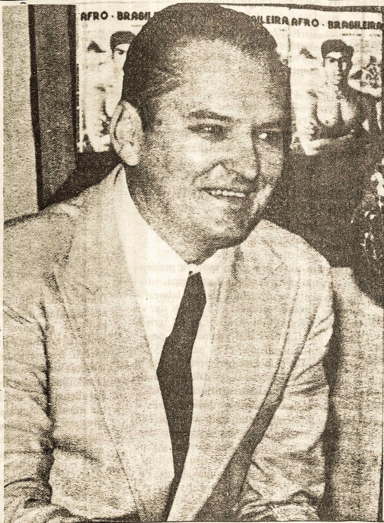
“ACADEMIA” ir “ORDEM”

N EKARTĄ buvo pasisakyta apie klaidingumą pirmojo kraštutinumo, skelbiančio kultūrinės veiklos kėlimą ir politinės neigimą. Tauta, kuri puoselėja vien kultūrinį savo gyvenimą, pasitenkindama net ir vergijos sąlygomis, lieka primityviame lygyje ir stato pavojų pačiai savo kultūrai. Politiškai iškilusi stipresnė tauta pradeda diktuoti silpnesnei, sunkina jos kultūrinę veiklą ir palengva ima ją išstumti iš viešojo gyvenimo ir naikinti. Tauta, nekovoianti už laisvos savo valstybės sukūrimą, pasmerkia ir savąją kultūrą sunykimui, nes nekovoja už būtinas sąlygas kultūriniam gyvenimui pilnai klestėti. Panašiai yra su kitu kraštutiniu, skelbiančiu vien politinės veiklos reikšmę. Tai irgi