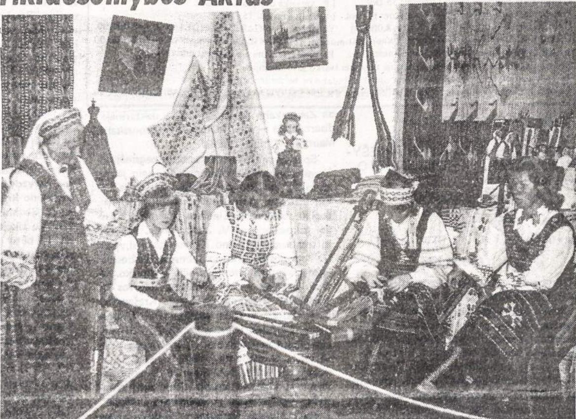
Tautinių tradicijų puoselėjimas palaiko meilę tėvų šaliai.

Vasario 16-sios Akto atkurta Lietuvos valstybė nėra panaikinta, o tik tai jėga okupuota ir prievarta prie Sovietų Sąjungos prijungta. Taigi, Lietuva yra agre-