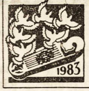
VI JAV IR KANADOS LIETUVIŲ DAINŲ ŠVENTĖ