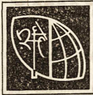
V PASAULIO LIETUVIŲ JAUNIMO KONGRESAS