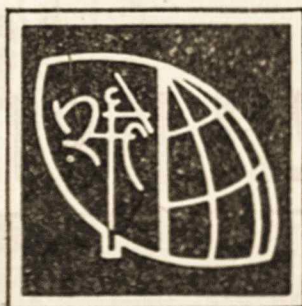
V PASAULIO LIETUVIŲ JAUNIMO KONGRESAS