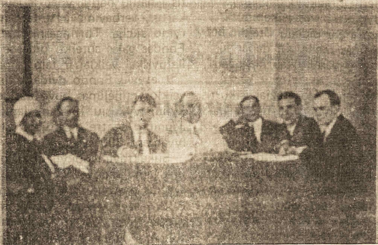
„Pietų Amerikos Lietuvis“ laikraščio redakcija