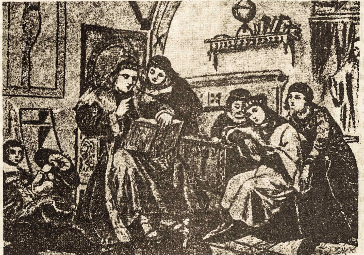
Dlugošo mokomi karalaičiai. Prie mokytojo šv. Kazimieras

Após a primeira biografia, outros autores italianos publicaram várias biografias do Santo em Nápoli, Palermo (Sicilia) e outras cidades, com contínuas reedições, tais como