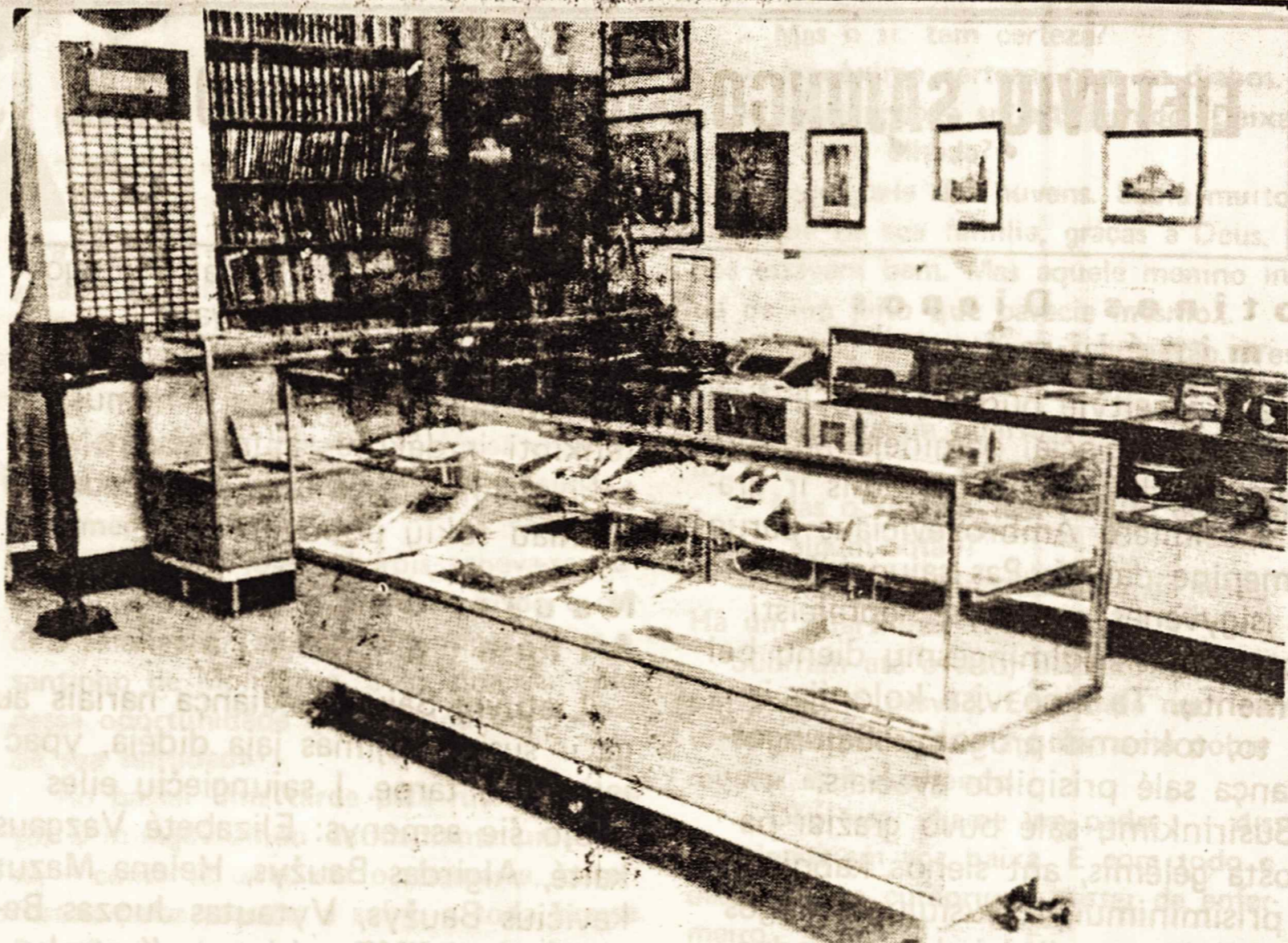
Balzeko Lietuvos Kultūros Muziejaus bibliotekos ir archyvinės medžiagos dalis. Biblioteka atdara kasdien nuo 1:00 iki 4:00 val. p. p. Visos knygos ir archyvinė medžiaga gali būti naudojama tik bibliotekoje.

Istorinė dalis informuoja apie mūsų pilis, tvirtoves, duoda karaliaus Mindaugo, kunigaikščio Gedimino, Bi-