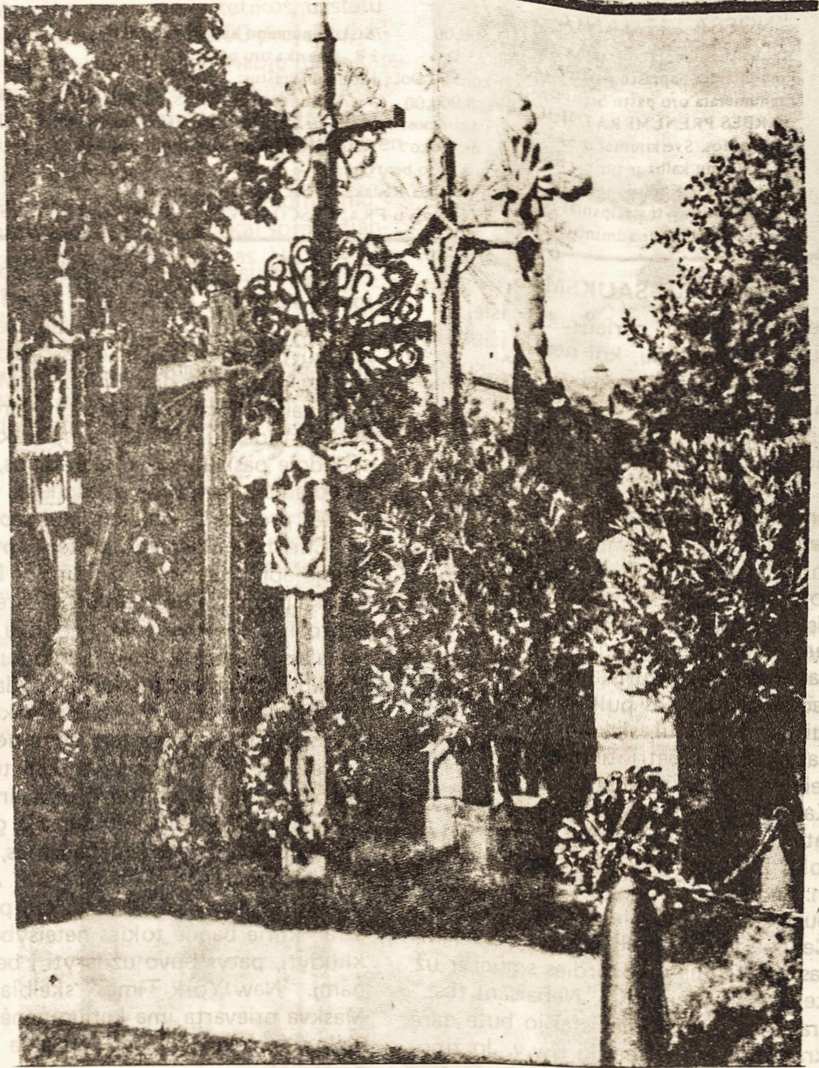
Lietuvoje, Nepriklausomybės laikais, Karo Muziejuje, prie Laisvės Kovų paminklo ir Nežinomo Kareivio kapo buvo dar pastatyta keletas originalių liaudies meno kūrynių, kopyltstulpių ir kryžių. Laisvės Kovų paminklą, o taip pat ir Nežinomo kareivio kapą bolševikai išgriovė ir sunaikino. Neliko nei šių gražių kryžių – liaudies meno.

Ukrainiečių savaitraštis "The Ukrainian Weekly" 1983 m. kovo 27 d. paskelbė dvidešimties tyrinėtojų surinktus apskaičiavimus Maskvos badu Ukrainoje išmarintų žmonių skaičiaus.