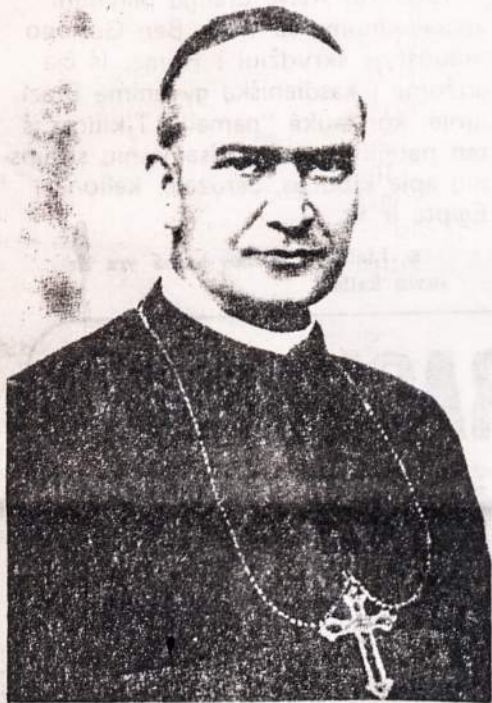
SERVO DE DEUS ARCEBISPO JORGE MATULAITIS RENOVADOR DA CONGREGAÇÃO DOS PADRES MARIANOS

Padres Marianos Cx. P. 9133 80.000 Curitiba, PR.