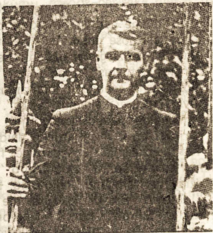
(tęsinys iš praeito nr.)

1968 n. perkėlė mane vadovauti Taisha misijos centrui, netoli Peru valstybės sienos. Ten buvo pradėtas šu- ar kivarų bendrabutis ir parapija, kuri tarnavo taipgi ten stovinčių kareivių šeimoms. Jie buvo užėmę Shell kompanijos pastatus ir aerodromą.