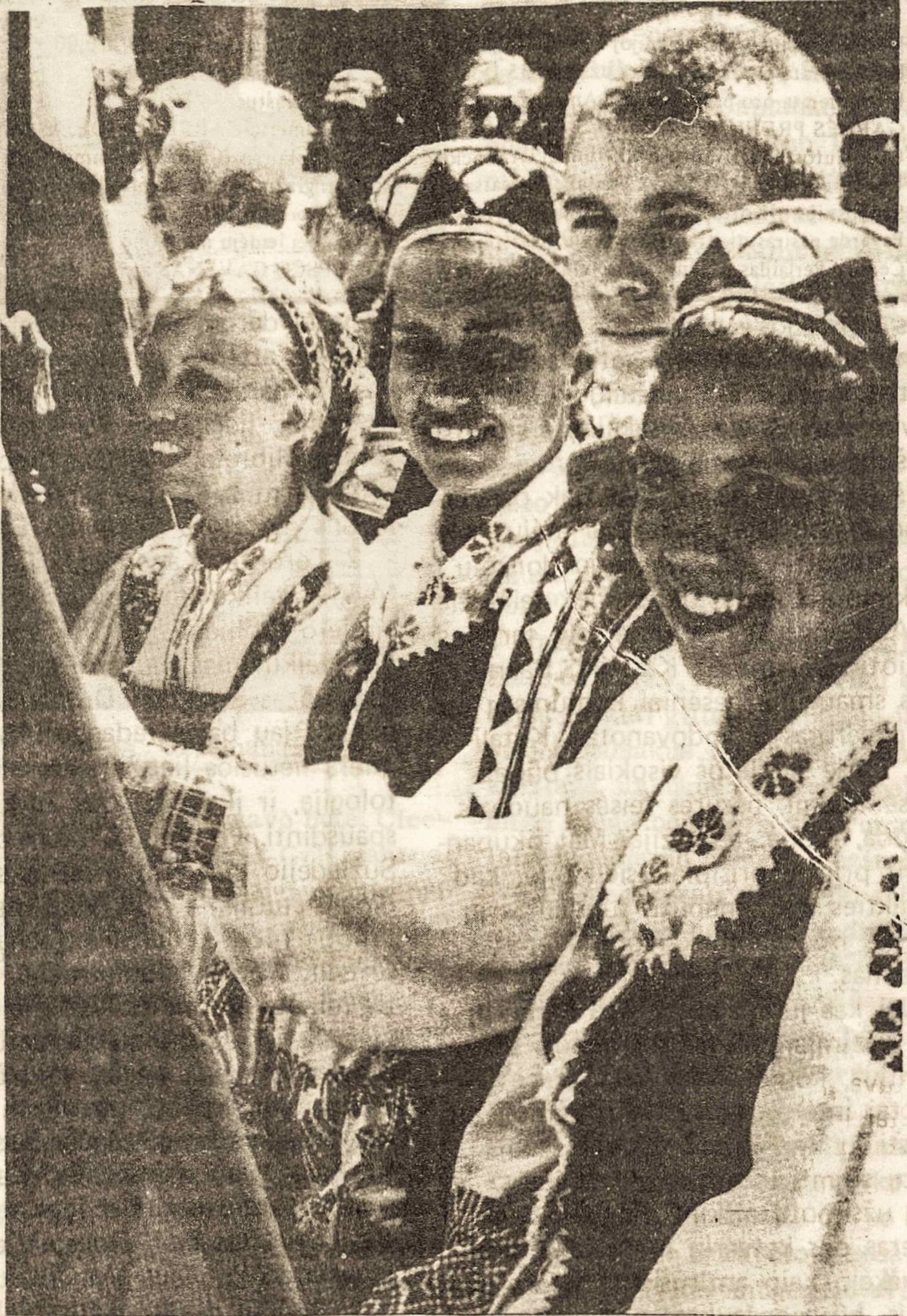
Urugvajaus sostinėje trečioji lietuvių emigrantų karta, minint Vasaric 16.

Nėra abejonės, jei nūdien Lietuva būtų laisva, šv. Kazimiero jubiliejus būtų panašiai, o gal ir iškilmingiau švenčiamas. Betgi laikas pasikeitė. Lietuva vėl pavergta to paties, tik daug nuožmesnio ir klastingesnio atėjūno. Niekinama, naikinama visa, kas mums yra brangu ar net šventa. Su šaknimis raunamas tikėjimas, biaurojama praeitis, mūsų tėvynainius visokiais būdais bandoma nutautinti, paversti rusais. Okupantas ir jam pasidavusieji didžiai išsigąsta, jei po nakties prie sodybos, pakelėje ar kryžiaus kalne pasirodo kryžiai. Jiem sunaikinti kartais kviečiasi net "nenugalimąją" Raudonąją armiją. Mūsų taurieji patriotai, bandantieji atsibastėliams priminti jų barbariškumą, žiauriai kankinami kalėjimuose bei priverčiamųjų darbų stovyklose. Vilniaus katedra, didysis mūsų tautos paminklas, šventovė, kurioje veik 500 m. ilsėjosi šv. Kazimiero relikvijos, 1953 m. paversta meno galerija, o Šventasis išguitas į priemiestį. Dabar jis ilsisi Šv. Petro ir Povilo bažnyčioje Antakalnyje. Šv. Kazimieras, kaip ir mes, nors ir savoje žemėje, tapo tremtinys. Dauguma bažnyčių, tarp jų ir istorinė Šv. Kazimiero Vil-