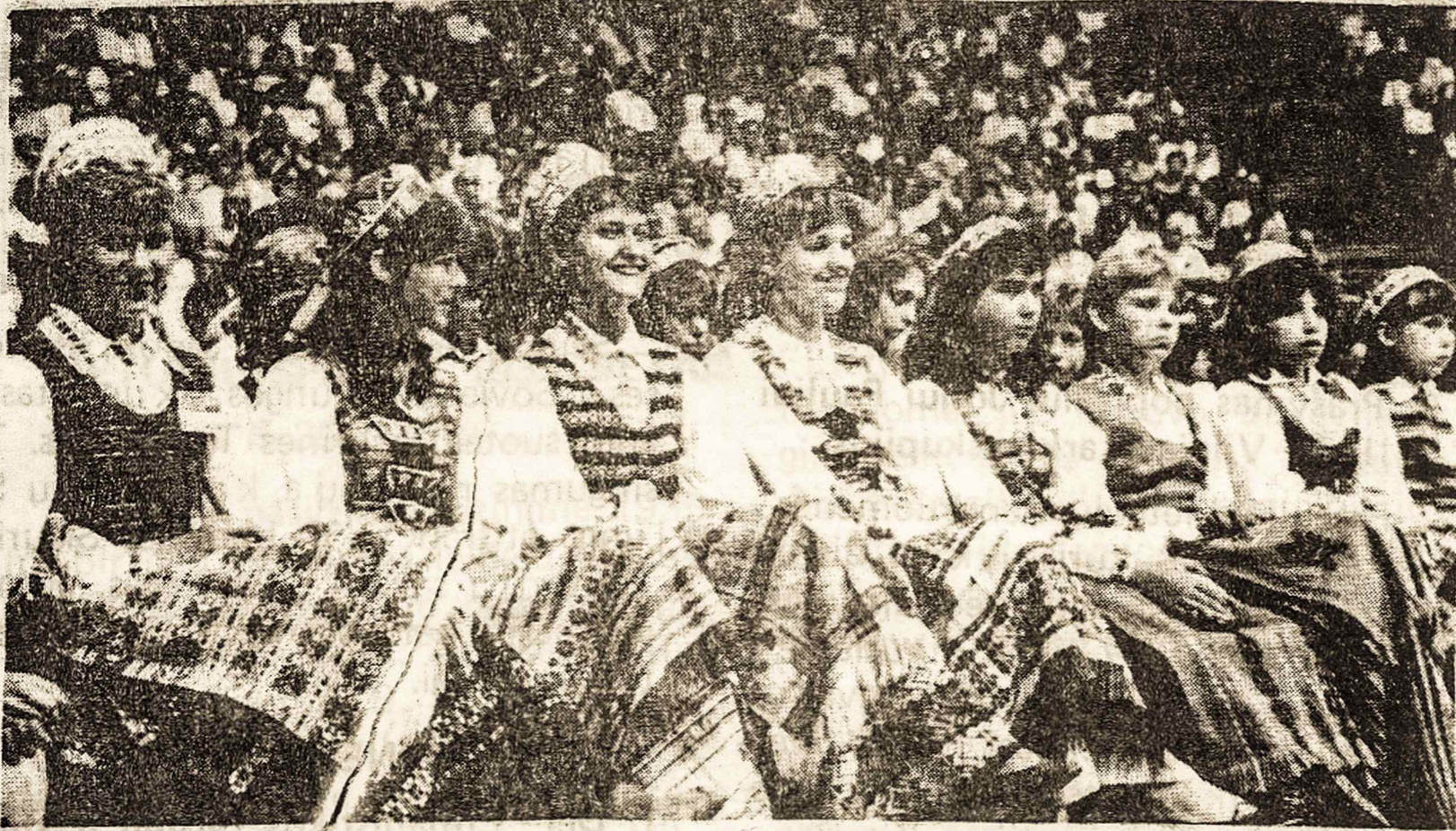
Jaunos dainininkės pasiruošusios dainuoti Dainų šventės metu.