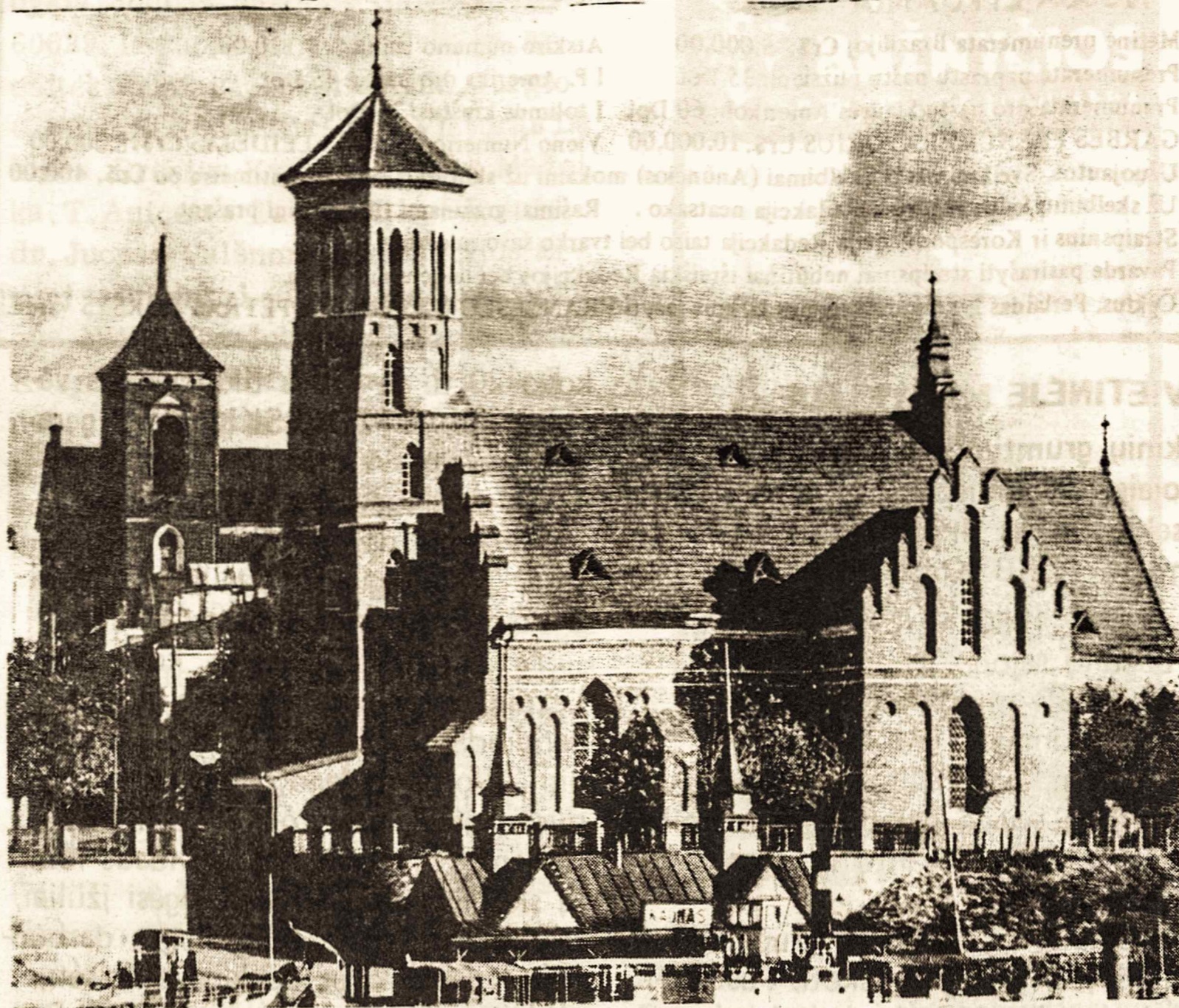
Dešinėj - Vytauto bažnyčia; kairėj - Kauno arkikatedros bažnyčios.

Kad skaitytojas galėtų sau susidaryti bent bendrą vaizdą, kiek dar daug kitų parengimų buvo pravesta tomis dienomis Chicagoje, čia bus suminėti tik darys svarbiausieji, antai V-asis Pasaulio Lietuvių Jaunimo Kongresas, V-asis AV ir Kanados Lietuvių Dainų šventė, II-osios Pasaulio Lietuvių Sporto Žaidynės, Mažosios Lietuvos Rezistencinio Sąjūdžio suvažiavimas, ir visa eilė kultūrinių renginių, iš kurių gal daugiausia garso užsipelnęs, tai kompozitoriaus Amilcare Ponchielli opera "I LITUANI", kurią "II-ųjų PLB Dienų" Kultūros Renginių Komitetas pastatė Chicagoje liepos mėnesio 21 dieną 1983 m. "The Auditorium Theatre" teatre, dalyvaujant penkių tūkstančių žiūrovų ir klausytojų publikai. Šios operos pastatymo proga, Illinois Valstybės Gubernatorius pasveikino raštu Chicagos Lietuvių Operos Kompaniją, kuriame, tarpe kitų lietuvių kolonijos įvertinimo žodžių, taip išsireiškė apie patį muzikos spektaklį: "This performance, in conjunction with the Second Lithuanian World Festival, will further enhance the importance of the Lithua-