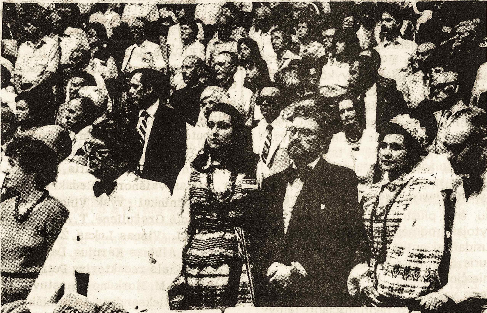
Prieky solistai ir dirigentai Dainų šventės metu.