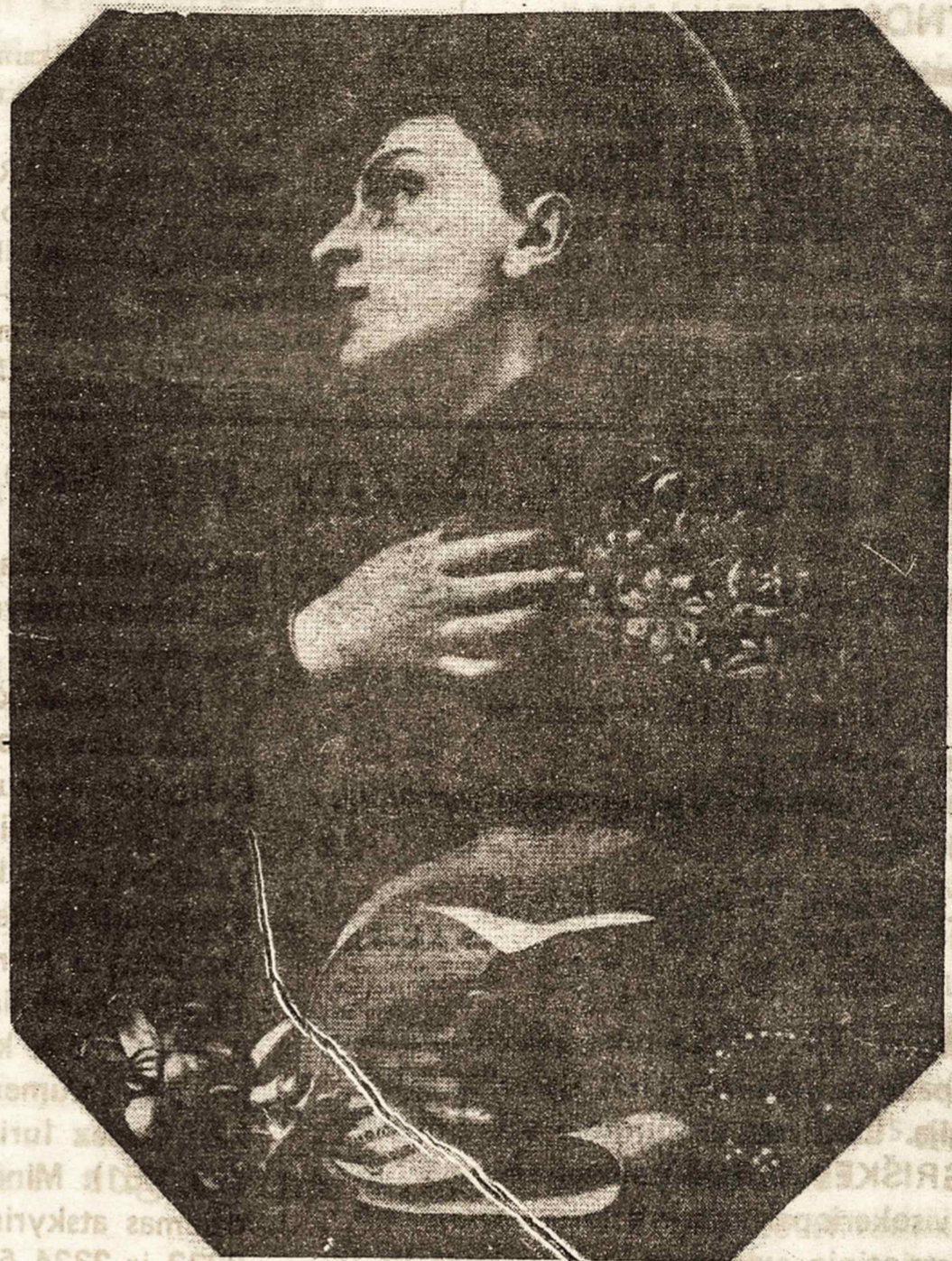
Šv. Kazimieras — Lietuvos Globėjas

Net ir sunkiausiais laikais, kai Rusijos caro valdžia trukdė kunigų paruošimą, uždraudė ir sunaikino vienuolynus, vistiek Lietuva turėjo pakankamai savo kunigų, buvo slapty vienuolijų. Ne tik gyvenantieji Lietuvoje, bet ir ištremtieji iš Lietuvos į Rusiją ten taip pat vykdė apaštalią misiją. Lietuvių ateivių Amerikėje buvo tokia dvasia, kad būdami beturčiais kūrė parapijas, statė bažnyčias, išauklėjo šimtus savų jaunų kunigų, steigė vienuolijas, šalpus draugijas, daugeliu atvejų pasirinkdami Šventą Kazimierą savo Globėju. Ir dabar svetimų okupuotoje Lietuvoje, žiauriose ateistinio komunizmo sąlygose, Lietuvos katalikai pasižymi savo drąsa, užsidegimu, noru likti ištikimais Dievui ir Bažnyčiai. Dvasinių pašaukimų į kunigus ir vienuolinį gyvenimą ten yra daugiau negu kaikuriuose laisvo pasaulio kraštuose. Visas pasaulis žino, kad šimtai tūkstančių lietuvių yra mirę kalėjimuose, Sibire vergų darbo stovyklose už savo krikščioniškus įsitikinimus, už laisvės ir kitų žmogaus teisių gynimą. Likusieji Lietuvoje kovoja už tas pačias teises. Daugelio kovojusių ir šventai mirusių vardai bei jų darbai gal nebus įrašyti į Bažnyčios paskelbtų šventųjų sąrašus, bet jų — kankinių ir išpažinėjų vardai yra įrašyti