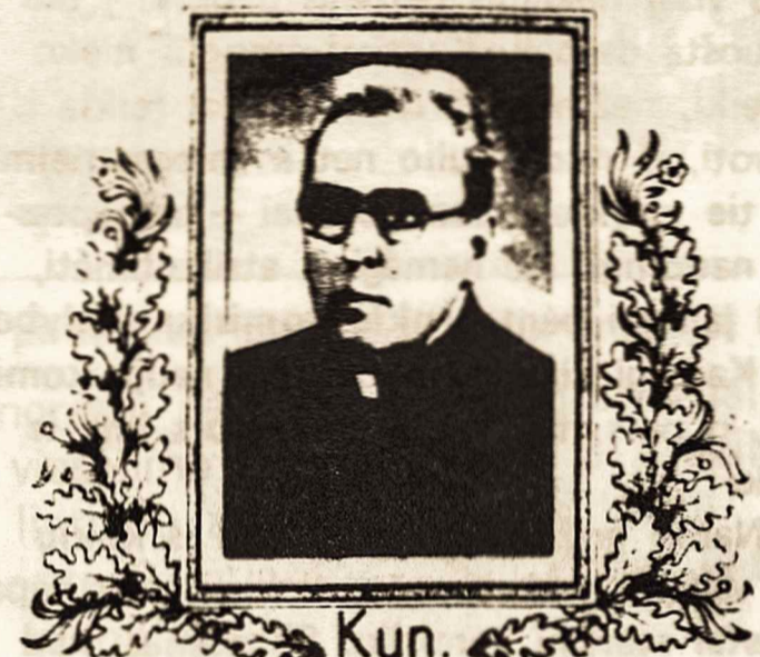
Kun. ALFONSAS SVARINSKAS