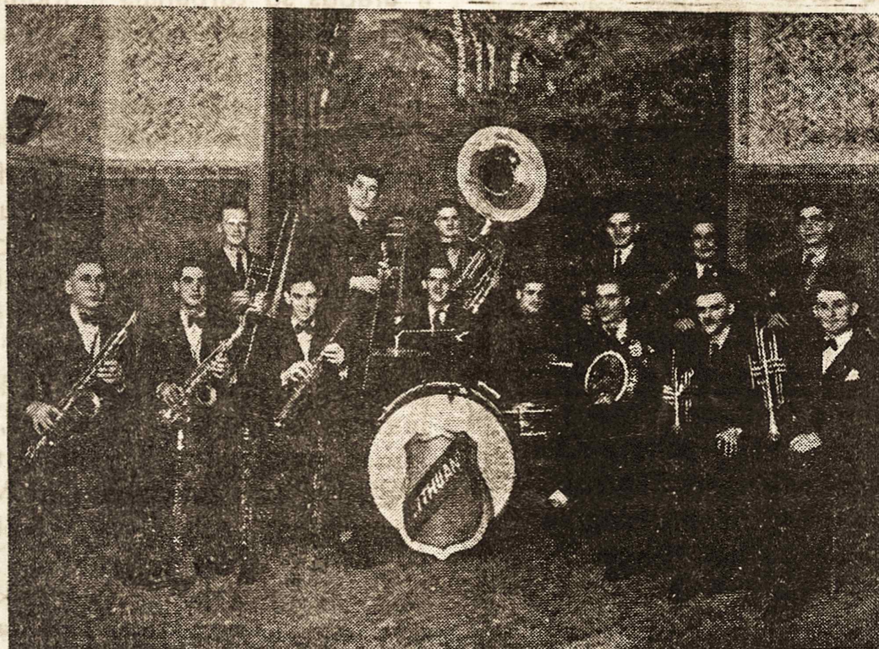
Buv. Sporto Sąjungos «Lituania» orkestras

Kreiptis į Šv. Kazimiero parapiją, R. Juatindiba, 28, tel. 273-0338